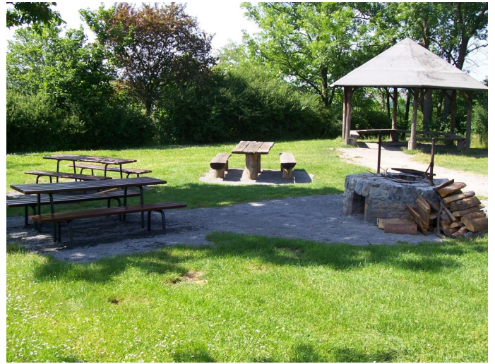
Autor Tanja Seegelke Quelle Touristikgemeinschaft HeilbronnerLand e.V.

HeilbronnerLand das Herz Baden-Württembergs