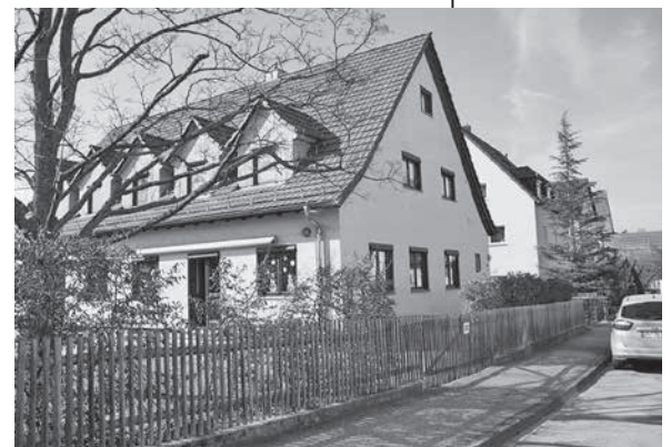
Kindergarten Herdegenstraße jetzt in städtischer Hand.

Zudem ist die bauliche Einrichtung einer Krippengruppe aus Sicht heutiger Bedarfsplanung vorausschauend wichtig, damit kurzfristig eine weitere Krippengruppe eröffnet werden kann.