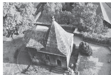
Regiswindiskapelle von oben