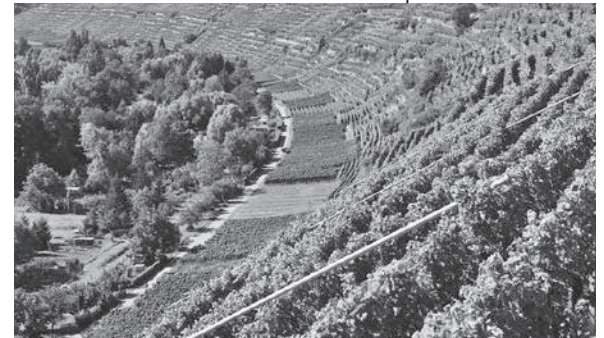
Steillagen in Lauffen a.N.

Während der Laufzeit werden verschiedene Beteiligungs- und Informationsangebote für Bürgerinnen und Bürger sowie Interessierte an-