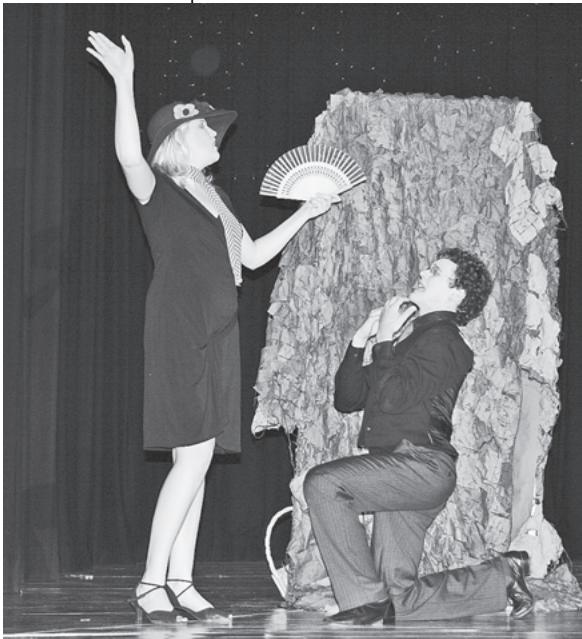
Mit Originalität in Sprache und Gestik begeisterten die Schülerinnen und Schüler ihre Zuschauer.

„Der verrückte Tag oder Figaros Hochzeit“ nach Beaumarchais in einer Aufführung der Theater-AG des Hölderlin-Gymnasiums