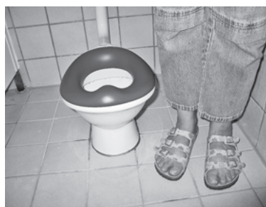
Auf die Größe der zukünftigen Benutzer abgestimmt: Ein kleines WC im umgebauten Waschraum.

Bislang stehen Familien am Ort verschiedene Tageseinrichtungen für Kinder zur Verfügung: Für 12 bis 36 Monate alte Kinder gibt es eine Kinderkrippe, für 3- bis 6-jährige Kinder stehen Plätze im Regelkindergarten, verlängerte Öffnungszeiten oder Ganztagesbetreuung bereit. Daran schließen sich Kernzeit- oder Hortbetreuung an. Dieses Angebot für Grundschulkindern ist auch einen Großteil der Schulferien geöffnet.