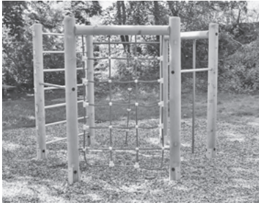
Frisch installiert, wartet das neue Klettergerüst am Neckarufer auf seine kleinen Besucher.

Nach 25 Jahren Klettern, Rutschen und Spielen wurden die bestehenden Spielgeräte auf dem Neckaruferspielplatz einer „Verjüngungskur“ unterzogen. Das Wetter hatte die Holzanlagen inzwischen angegriffen und teilweise schon morsch werden lassen.