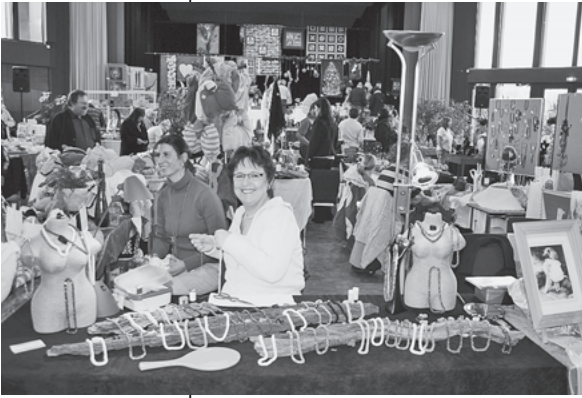
In der Lauffener Stadthalle kann man am kommenden Wochenende die Ergebnisse sorgfältiger Hobbykunst bestaunen und erwerben.

Am kommenden Wochenende, Samstag, 15. November, von 13 bis 18 Uhr und Sonntag, 16. November von 11 bis 18 Uhr findet die 7. Hobbykünstlerausstellung in der Lauffener Stadthalle statt.