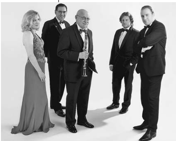
Begleitet wird Klarinetist Giora Feidman von den Streicher-Virtuosen des Gershwin-Quartetts.

Giora Feidman und Gershwin-Streichquartett treten zusammen auf