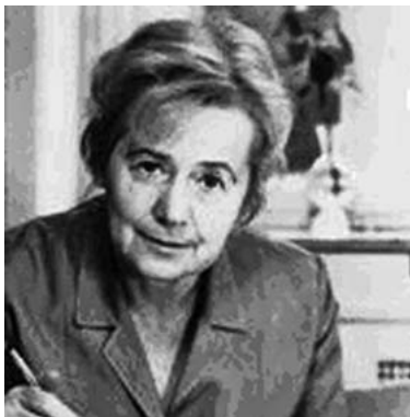
Hilde Domin

Flaschenpost auf dem Wasser der Zeit Mit „dein Theater“, Stuttgart