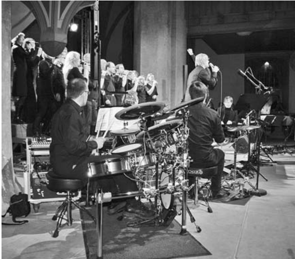
Der LAKI Pop-Chor begeisterte die Zuhörer

„In allen Kirchenbezirken sollen regelmäßig Gottesdienste mit qualifizierter Populärmusik stattfinden“, lautet eine der drei Forderungen der Arbeitsstelle musisch-kulturelle Bildung des Evangelischen Jugendwerks in Württemberg (ejw). Und der LAKI-PopChor, der am Sonntag seine diesjährige Frühjahrs tournee durch's Ländle mit einem Auftritt in der Regiswindiskirche abschloss, ist sozusagen ein Botschafter in Sachen neuer evangelischer Kirchenmusik. Der Popchor der Landeskirche singt seit zehn Jah-