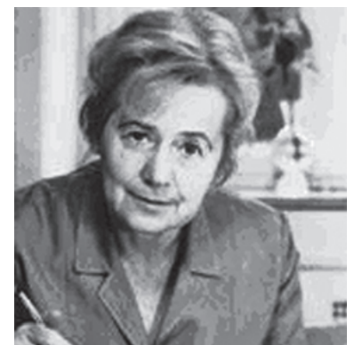
Hilde Domin