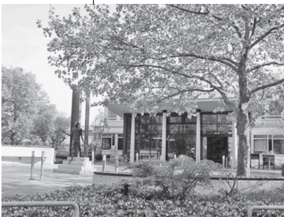
Diskutieren Sie mit um die Zukunft des nahe gelegenen Brackheimer Krankenhauses.

Um Zukunftsperspektiven für das Krankenhaus Brackenheim geht es beim Heilbronner-Stimme-Forum am Montag, 19. April, ab 19 Uhr im Bürgerzentrum in Brackenheim.