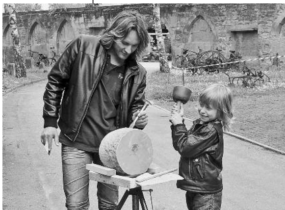
Bei der Sandsteinbearbeitung durften die Besucher auch mal selbst Hand anlegen.

Kunst entstand, Theater wurde gespielt, die bestehenden Ausstellungen wurden besichtigt, zusammen wurde der Tag genossen. Ein wür-