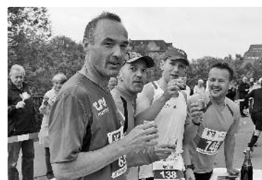
Ein Gläsle Trolli zur Stärkung wurde auch auf der Lauffener Neckarbrücke nicht abgelehnt.

Originelle Kostüme wie ein laufender Elefant und ein Römer sowie weingenußfreundige Trollis, die sich auf der Alten Neckarbrücke ein Gläschen