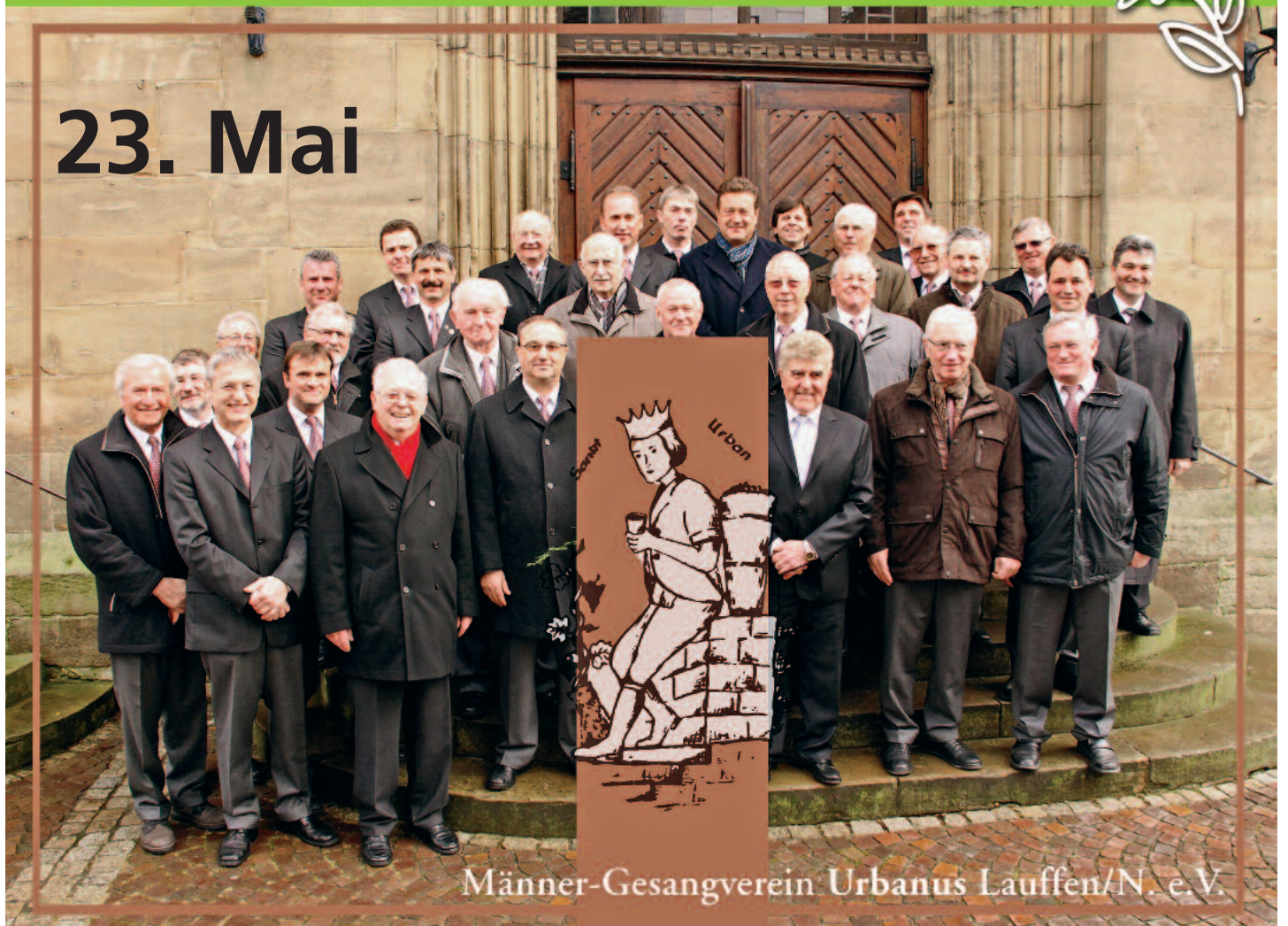
Männer-Gesangverein Urbanus Lauffen/N. e. V.