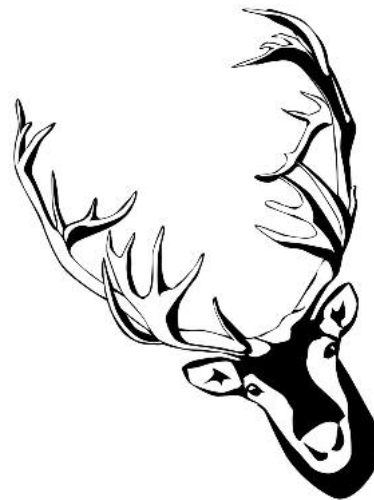
Erleben Sie im Lauffener Burghof eine turbulente Liebeskomödie – Happy end inklusive.

In den Wald von Arden führt Meister Shakespeare seine Liebespaare um 20 Uhr in der leichten Sommerkomödie „Wie es Euch gefällt“ und führt sie außerdem ziemlich an der Nase herum – sehr zum Vergnügen des Publikums. Und so nimmt der köstliche Liebesreigen um den jungen Orlando und seine liebreizende Rosalinde vor der romantischen Kulisse der Lauffener Burg seinen Lauf. Es beginnt ein erotisches Spiel voller unterdrückter Leidenschaften und verrirrter Sehnsüchte.