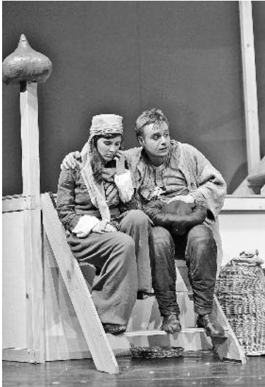
Hochspannung mit einem Märchen aus Tausendundeiner Nacht: Ali Baba und die 40 Räuber.

Am Sonntag, 20. Juni, wird der Hof der Lauffener Rathausburg wieder zur idyllischen Kulisse für das Open-Air Theatervergnügen mit der Badischen Landesbühne.