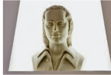
Lauffen a. N. ist eng mit seinem „großen Sohn“ verbunden, das zeigt auch das Hölderlin-Zimmer im Museum Klosterhof, aus dem dieses Foto stammt – ein Besuch lohnt sich.