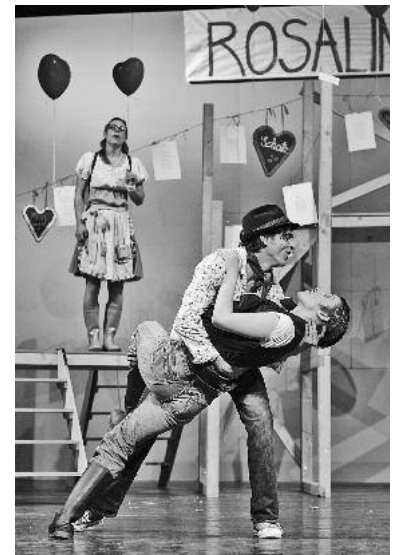
Szenenfoto aus „Wie es euch gefällt“

ein erotisches Spiel voller unterdrückter Leidenschaften und verirrter Sehnsüchte. In mal dramatischen, mal komischen Situationen wird die Geschichte der Liebenden zu einem höchst amüsanten Verwirrspiel. Der Eintritt zu diesem prickelnden Sommervergnügen kostet 16 € (erm. 8 €). Karten gibt es für beide Veranstaltungen im Vorverkauf im Lauffener Bürgerbüro (Tel. 07133/20770), unter www.lauffen.de sowie an der Tageskasse. Sollte Regen angesagt sein, finden beide Aufführungen in der Stadthalle statt.