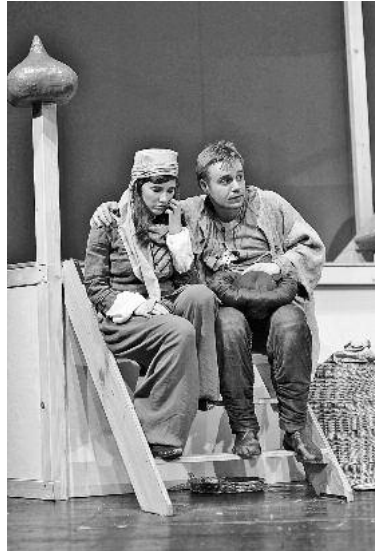
Hochspannung mit „Ali Baba und den 40 Räufern“.

Wetter an ausreichend Sonnenschutz für die kleinen und großen Besucher der Nachmittagsvorstellung für ungetrübten Theaterspaß!