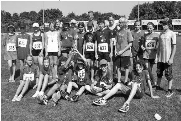
Weitere Fotos finden Sie auf der Homepage der Hölderlin-Realschule ( www.hrs-lauffen.de ).

Beim Theodor Heuss Lauf über 2,5 Kilometer in Brackenheim waren Schülerinnen und Schüler der Hölderlin-Realschule Lauffen a. N. (HRS) erfolgreich. Das Schulteam mit Läuferinnen und Läufern aus den Klassenstufen 5 bis 7 schaffte es mit Ehrgeiz und Siegeswille auf Platz 1.