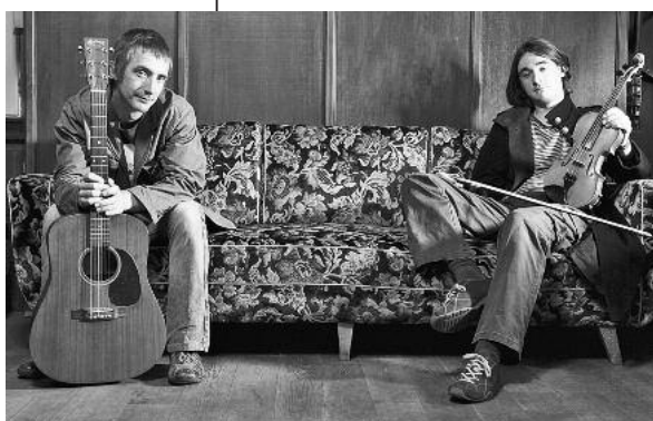
Britischer Humor gepaart mit gefühlvollen Interpretationen: die Band Broom Bezzums begeistert ab 20 Uhr auf der Irischen Nacht.

Hochkarätige Folk-Musik mit internationalen Bands, sprühende Lebenslust, Guinness und irische Spezialitäten: Das Folk-Festival „Irische Nacht“ im Lauffener Burghof holt am Samstag, 17. Juli, ab 18 Uhr die internationalen Stars der Folk-Szene auf die Neckarbühne: North Sea Gas (Sco), L. Bow Grease (Ger/UK), Broom Bezzums (UK) und Colin Wilkie.