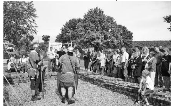
Inmitten der Weinberge können die Besucherinnen und Besucher römische Vergangenheit und heutige Weinkultur hautnah erleben.

Kulinarische Genüsse bieten die Damen des KIWANIS-Clubs Heilbronn-Helibrunna e. V. an. Spezialitäten nach altrömischen Rezepten korrespondieren mit ausgewählten Weinen der Lauffener WG. ■