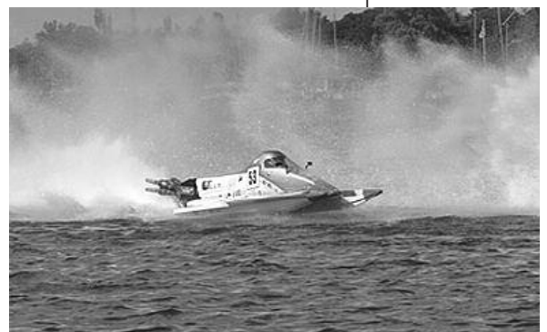
Motorboot-Rennsport vom Feinsten lässt die Fans wieder voll auf ihre Kosten kommen.

Eintrittskarten gibt es an der Tageskasse zu 5 Euro nur für samstags und zu 11 Euro für samstags und sonntags zusammen. Weitere Informationen gibt es unter Tel. 0172/7034444. ■