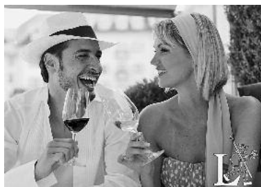
Mit einem schönen Glas Rot- oder Weißwein können die Inselgäste von 4. bis 6. September wieder anstoßen. (Design: Schwarzkopf)

Zertifiziertes „Württembergischer Weinfest“ ist Lauffens Wein auf der Insel seit dem vergangenen Jahr. Das Konzept der entspannten Weinprobe mit guter Unterhaltung in angenehmer Atmosphäre überzeugte die verantwortliche Kommission um den Geschäftsführer des Weininstituts Württemberg Ulrich Breutner. Von 4. bis 6. September lädt die Genießer-Insel wieder ein – überzeugen Sie sich selbst. Eröffnet wird das romantische Festival auf der Insel am Samstag um 18 Uhr durch Bürgermeister Klaus-Peter Waldenberger und die Württembergische Weinkönigin Juliane Nägele.