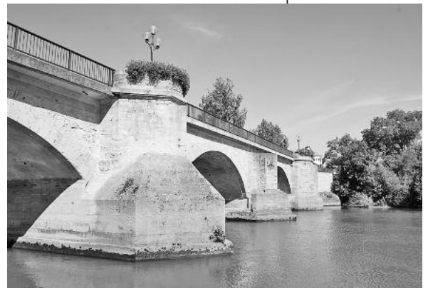
Ben Sie dort – vor oder nach dem Neckar-Rundweg – frische Backspezialitäten und Getränke. ■

Das Backhaus lädt an diesem Tag ab 11 Uhr zum Backhausfest ein. Genie-