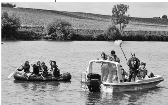
Auf dem Wasser mussten die Teilnehmer flößen – das SWR-Team filmte vom Boot aus.

Entspannter und genussvoller Dreh am Flussufer