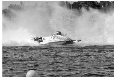
Motorboot-Rennsport vom Feinsten lässt die Fans wieder voll auf ihre Kosten kommen.

In der Klasse ADAC MSG Motorboot Cup wird der Jahresmeister gekürt in den Rennbootklassen als auch im spannenden Match-Race um den beliebten ADAC Rhein-Mosel-Neckar-Cup 2010.