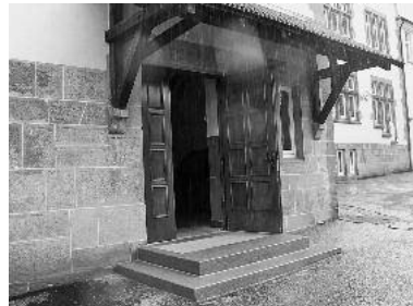
Die Herzog-Ulrich-Grundschule in der Vorbereitung aufs neue Schuljahr.

Vor der Haupteingangstüre der Schule wurde in den Ferien ein Podest eingebaut, damit die Türe umgedreht werden kann und somit in Fluchrichtung öffnet um die Sicherheit z. B. im Brandfall noch zu erhöhen.