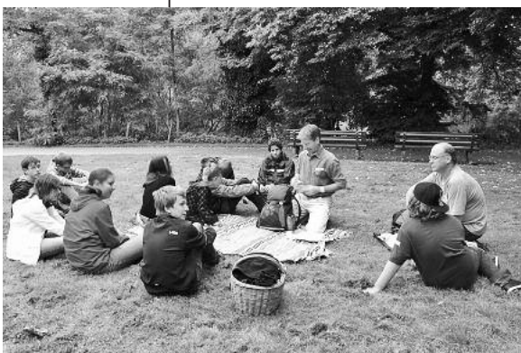
Mit Spannung wird die Bat Night erwartet, hier die Einführung am Kiesplatz – bevor es dunkel wurde.

Letzter Programmpunkt schließt das Ferienprogramm 2010 spannend ab