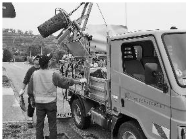
Mit Hilfe des Sinkkastenreinigers werden die Schächte gereinigt.

Mitarbeiter des städtischen Bauhofs werden in den nächsten Wochen im gesamten Stadtgebiet Schächte reinigen, damit auch bei stärkeren oder länger anhaltenden Regenfällen der Wasserabfluss nicht behindert wird und die Anwohner vor Überschwemmungen und daraus folgenden Verschmutzungen sicher sind.