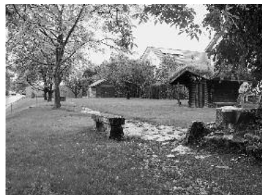
Neben z. B. Fassadensanierungsarbeiten am Hölderlin-Gymnasium und der -Grundschule wurde der Schulgarten hergerichtet.