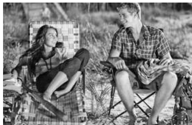
17 Uhr: Emotionsgeladene Verfilmung des Bestsellers von Nicholas Sparks, USA 2010, FSK ab 6 J.