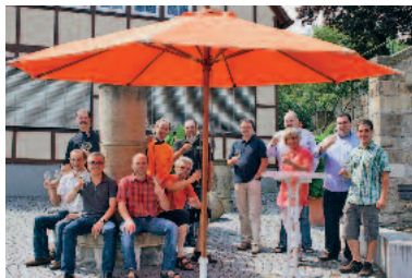
Die Teilnehmer von Wein auf der Insel 2010 freuen sich, Sie auf der Insel begrüßen und verwöhnen zu dürfen.

Die verschiedenen Lauffener Weingüter und Gastronomen sowie die Lauffener Weingärtner eG veranstalten „Wein auf der Insel“ zum siebten Mal gemeinsam mit der Stadt Lauffen a. N. Neu mit dabei sind die örtlichen Jungwinzer mit ihrer Vinitiative im Garten, auf die man gespannt sein darf. Gefei-ert wird am Samstag und am Montag ab 17 Uhr, am Sonntag bereits ab 11 Uhr. Musikalisch begleitet werden die Abende auf der Insel jeweils von 19 bis 23 Uhr durch Mike Janipka und Jürgen Fälchle, das Oldtime Jazz Collegium und das Trio Dicke Fische.