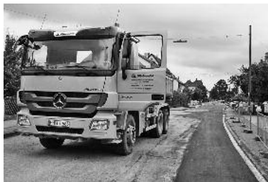
In der Hölderlinstraße wurden Wasser- und Gasleitungen erneuert.

In der Hölderlinstraße wurden die Wasser- und Gasleitungen in einem Teilbereich der Straße durch die HVG erneuert. In diesem Zuge wurde die Fahrbahndecke in der Hölderlinstraße zwischen Schillerstraße und Urbanstraße durch die Stadt erneuert. Im Bereich der Hölderlinrealschule wurden der Gehweg und die Entwässerungsrinne erneuert. Die gesamten Baukosten belaufen sich auf 80.000 Euro inklusive Mehrwertsteuer. Die Baumaßnahme wurde am 31. Mai begonnen und konnte am vergangenen Freitag, 27. August, fertig gestellt werden.