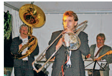
Das Oldtime Jazz Collegium tritt am Sonntag auf

Am Sonntag begleitet hier das Oldtime Jazz Collegium einen genussvollen Abend mit Jazz im Stil der 20er-Jahre, wie er aus New Orleans, Chicago und Harlem, New York, bekannt ist. Zusätzlich wird es am Sonntag gleich zum Auftakt um 11 Uhr eine Führung durch das Burgmuseum geben, die durch die zahlreichen Mitmach-Elemente besonders für Familien mit Kindern geeignet ist. Danach kann man im Burghof gemütlich zu Mittag essen. Auch den Blick von der Turmspitze der Burg auf das Festgeschehen, den Fluss und die von Weinreben umgebene Stadt von 14 bis 16 Uhr werden sich sicher nur Wenige entgehen lassen.