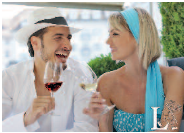
Mit einem schönen Glas Rot- oder Weißwein können die Inselgäste von 4. bis 6. September wieder anstoßen. (Design: Schwarzkopf)

Zertifiziertes „Württembergischer Weinfest“ ist Lauffens Wein auf der Insel seit dem vergangenen Jahr. Das Konzept der entspannten Weinprobe mit guter Unterhaltung in angenehmer Atmosphäre überzeugte die verantwortliche Kommission um den Geschäftsführer des Weininstituts Württemberg Ulrich Breutner. Von 4. bis 6. September lädt die Genießer-Insel wieder ein – überzeugen Sie sich selbst. Eröffnet wird das romantische Festival auf der Insel am Samstag um 18 Uhr durch Bürgermeister Klaus-Peter Waldenberger und die Württembergische Weinkönigin Juliane Nägele.