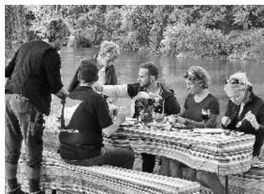
Leckeres Essen konnten sowohl Teilnehmer als auch Gäste auf dem Kiesplatz genießen.

Rund 250 Zuschauer hatten sich in Lauffen auf dem Kiesplatz eingefunden, um die Open-air-Köchinnen und -Köche gemütlich bei den Essensvorbereitungen zu beobachten und auch den Leuten vom Fernsehen über die Schulter zu schauen, bei ihrer zeitaufwendigen Arbeit.