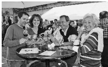
In entspannter Atmosphäre Weine verkosten.

Die Weingärtner eG schenkt bei der gemütlichen Open-Air-Weinprobe in Lauffen besonders gerne einen 2009er Katzenbeißer Grauburgunder Kabinett trocken „Poet Mörike“ aus. Der Grauburgunder begeistert mit viel Körper und Fülle. Im Bukett ist er delikat und voll, dabei mit kräftig-würzigem Geschmack und milder Säure ausgestattet. Sehr empfehlenswert ist dieser Weißwein zu Wildgeflügel, Gänsepastete, Schweinmedaillons mit Sahnesauce, frischen Salaten oder mildem Käse.