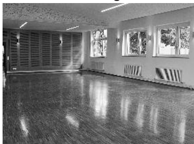
Der neue Musiksaal in der Musikschule wird fürs erste Konzert hergerichtet.