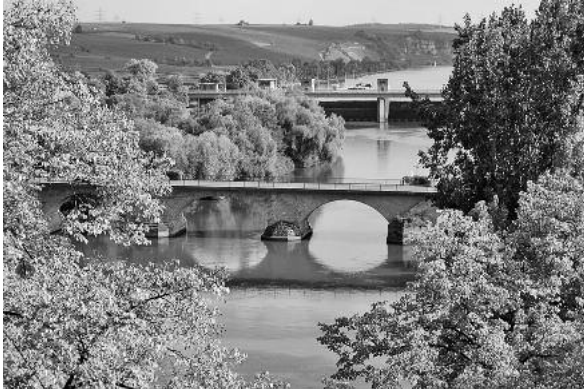
Die Alte Neckarbrücke ist Teil des Erkundungswegs am Tag des offenen Denkmals 2010.

Der Tag des offenen Denkmals am Sonntag, 12. September, trifft in diesem Jahr mit dem Thema „Reisen, Handel und Verkehr“ direkt in die Historie der Stadt Lauffen.