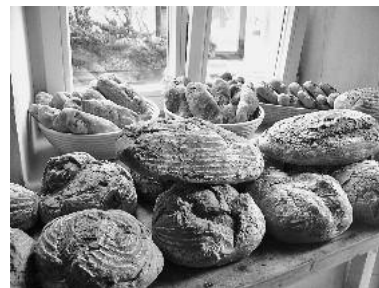
Solche Leckereien gibt es beim Backhausfest für die Gäste zu Hauf – schauen Sie vorbei!

Unterstützt wird das Backhausteam durch den Heimatverein und Schüler des Hölderlin Gymnasiums. ■