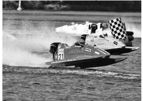
Motorboot-Rennsport vom Feinsten lässt die Fans wieder voll auf ihre Kosten kommen.

Eintrittskarten gibt es an der Tageskasse zu 5 Euro nur für samstags und zu 11 Euro für samstags und sonntags zusammen. Weitere Informationen gibt es unter Tel. 0172/703 4444. ■