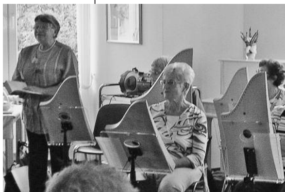
Die Neckarwestheimer Veenharfengruppe verzauberte ihre Zuhörer.