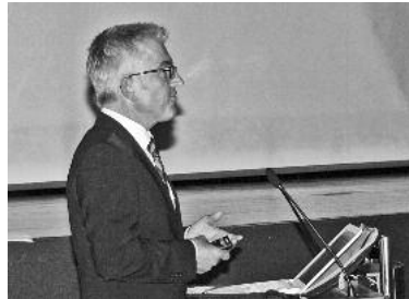
Bürgermeister Klaus-Peter Waldenberger informiert über die Stadtentwicklung.

zungskosten bezahlen zu können, das geht nicht lange gut“, erklärte der Rathauschef. „Hier wird sich der Gemeinderat demnächst mit möglichen Einsparpotenzialen im Bereich der Personalausgaben als auch der freiwilligen Aufgaben befassen müssen“, kündigte Waldenberger an. Dass das alles andere als ein Spaziergang wird, ist allen bewusst, gerade im Personalbereich wären teils eher Verstärkungen als Einsparungen angebracht – angefangen mit einem ganz kleinen Thema, wofür erst kürzlich ein weiterer Ordnungshüter in Teilzeit eingestellt wurde: der notwendigen Kontrolle der Hundehalter auf die Einhaltung der Hundetoiletten-Nutzung .