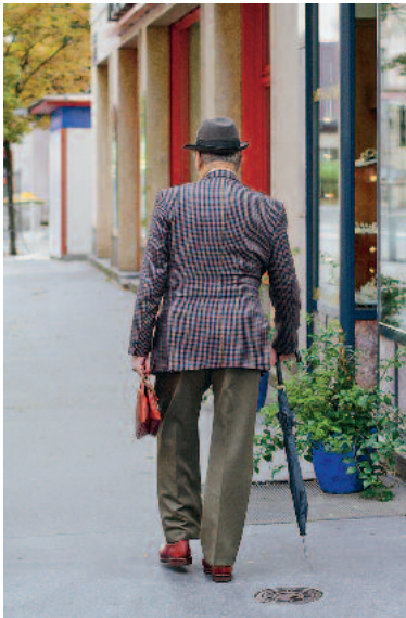
Ein wichtiges Ziel, das Lauffen a. N. mit dem gesellschaftlichen Engagement im Ruhestand anstoßen möchte ist die Vermeidung von Vereinsamung.

Die Gesellschaft in Deutschland wird älter, die Lebenserwartung des Einzelnen steigt und die Geburtenzahlen bleiben niedrig. Wie viele andere Kommunen steht auch Lauffen a. N. vor entsprechenden Zahlen: 18,5 % der Bürgerinnen und Bürger sind heute 65 Jahre und älter, bereits 30 % sind 55 Jahre und älter.