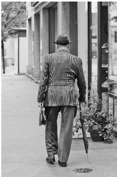
Ein wichtiges Ziel, das Lauffen a. N. mit dem gesellschaftlichen Engagement im Ruhestand anstoßen möchte, ist die Vermeidung von Vereinsamung.

Die Gesellschaft in Deutschland wird älter, die Lebenserwartung des Einzelnen steigt und die Geburtenzahlen bleiben niedrig. Wie viele andere Kommunen steht auch Lauffen a. N. vor entsprechenden Zahlen: 18,5 % der Bürgerinnen und Bürger sind heute 65 Jahre und älter, bereits 30 % sind 55 Jahre und älter.