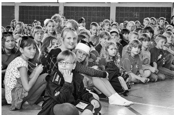
Die Kinder haben Little City 5 sehr genossen.

Die Schulferien liegen schon einige Zeit zurück, aber für 420 Mitwirkende bleiben schöne Erinnerungen an die 5. Kinderspielstadt „Little City“.