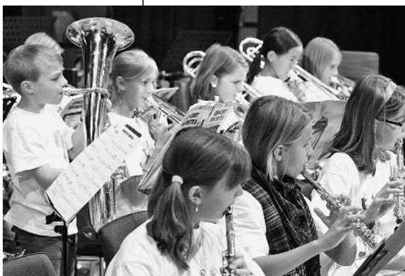
Einen schönen musikalischen Abend mit der Jugendabteilung der Stadtkapelle bietet das Herbstkonzert.

Am Freitag, 29. Oktober, lädt die Stadtkapelle um 19.30 Uhr zum Jugend-Herbstkonzert in die Stadthalle ein.