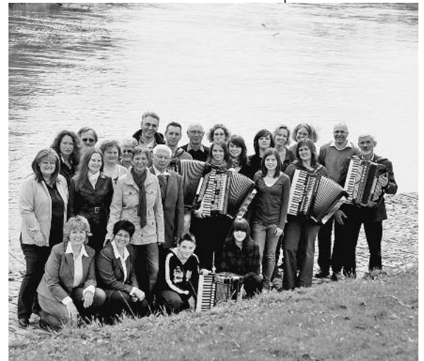
Karten für das Konzert gibt es bei der Firma Stöcker in Lauffen a. N. und an der Abendkasse. ■

Seit 80 Jahren ist das Akkordeon-Orchester Lauffen (AOL) ein wichtiger Bestandteil in der Lauffener Kulturlandschaft. Der Verein ist einer der ältesten und größten Akkordeonvereine in Nordwürttemberg. Besonderes Augenmerk legen die Verantwortlichen auf die musikalische Ausbildung der diversen Jugendgruppen. Bereits im Vorschulalter können die Kinder mit der Melodica einsteigen. Außerdem wird Keyboard- und natürlich Akkordeonunterricht erteilt. Altersmäßig sind die Spielerinnen und Spieler beim AOL bunt gemischt – vom sechsjährigen Anfänger bis zum 75-jährigen „alten Hasen“. Somit bleibt der Verein lebendig und interessant.