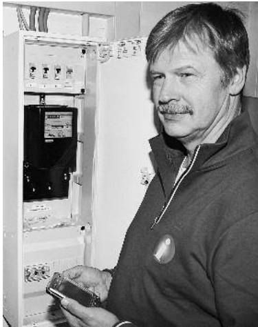
Zählerstände werden persönlich vor Ort abgelesen

Kundencenter Energiestandort Heilbronn investiert in Kundenservice