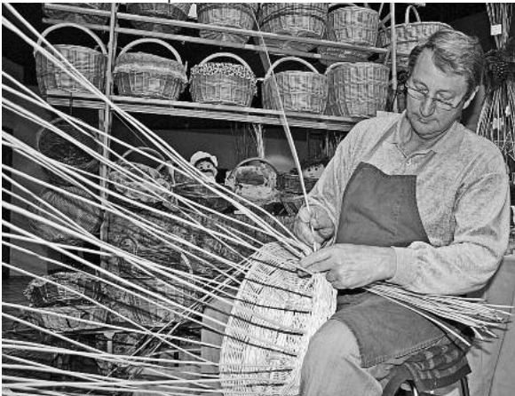
Viel sorgfältige Handwerkskunst verschiedenster Ausprägungen kann zur Hobbykünstlerausstellung 2010 wieder bestaunt werden.

Am Samstag, 13. November, von 13 bis 18 Uhr und Sonntag, 14. November von 11 bis 18 Uhr findet die 9. Hobbykünstlerausstellung in der Lauffener Stadthalle statt.