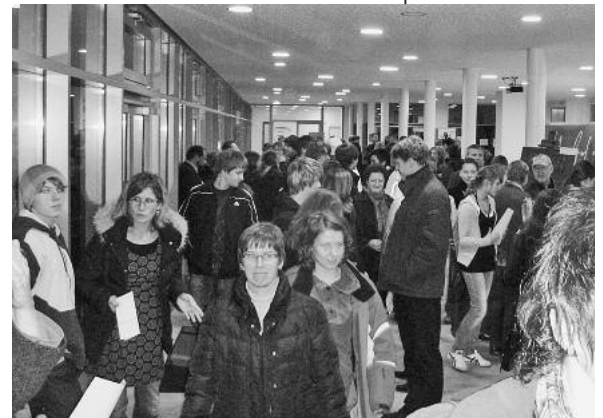
Schulsozialarbeit Lauffen a. N. engagieren sich um Hilfestellungen im Bereich des Übergangs von der Schule in die Berufswelt. ■

Die Veranstaltung wird vom Arbeitskreis 3 der Lauffener Agenda Jugend durchgeführt. Die Vertreter der Berufsberatung der Agentur für Arbeit Heilbronn, der ARGE Landkreis Heilbronn, der JuLe Lauffen a. N. und der