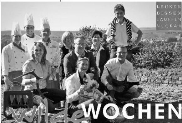
Vom 6. bis 21. November 2010 haben alle Interessierten die Gelegenheit wieder „Lauffener Lecker Bissen“ zu genießen.

Man nehme ein gemeinsames kulinarisches Motto, verschiedene Lauffener Gastronomiebetriebe und die Lauffener Weingärtner eG mit ihren besonderen Tropfen. Dann hat man alle Zutaten für die am 6. November startende Gourmet-Aktion „Lecker Bissen Lauffen Neckar“.