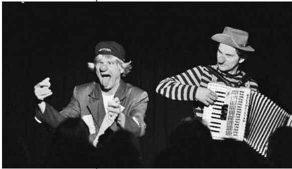
Die Clowns leben gefährlich: Ein Clownsmörder geht um.

Ein Mordsvergnügen erwartet die Besucher der Lauffener MordsMuseumsNacht am Samstag, 13. November, um 20 Uhr im Museum im Klosterhof.