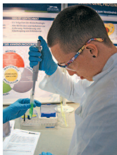
Das BioLab bietet Jugendlichen und jungen Erwachsenen Praktika nach dem „Hands-on Science“-Prinzip.

Das „BioLab“ bietet Jugendlichen und jungen Erwachsenen Praktika nach dem „Hands-on Science“-Prinzip und jede Menge spannende Informationen über Forschung, Anwendung und Entwicklungspotenziale im zukunftsweisenden Technologiefeld „Biotechnologie“. Außerdem stellt das Projekt der Baden-Württemberg