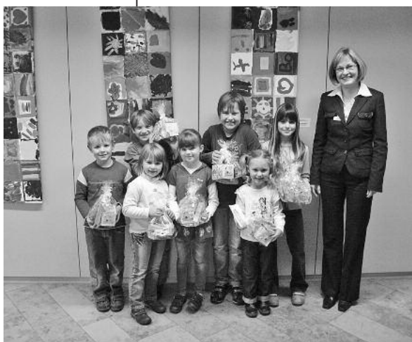
Die stolzen Gewinner des Malwettbewerbs versammelt.

„Mehr Biss für dein Sparschwein“ hieß es im Rahmen der Jugendsparwoche vom 25. bis 29. Oktober 2010 bei der Kreissparkasse Heilbronn. Rund 2000 Kinder zwischen 6 und 12 Jahren ließen sich im Halloween-Outfit vor einer gruseligen Leinwand fotografieren. Dabei waren die Kinder sehr einfallsreich: vertreten waren Vampire, die unterschiedlichsten Tiere, Kürbisse sowie andere gruselige Gestalten. Alle Fotos sind sortiert nach Filiale und Tag unter der Adresse www.kreissparkasse-heilbronn.de/jugendsparwoche zu sehen. Wer bisher sein