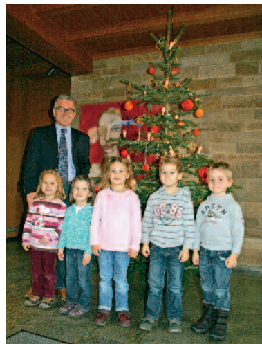
Stolz präsentiert das Schmück-Team aus dem Kindergarten Brombeerweg dem Bürgermeister sein Werk, der freut sich sehr über den schönen Weihnachtsbaum.