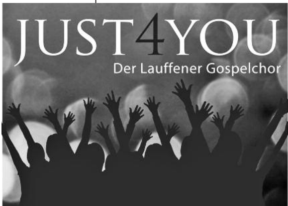
Die Sängerinnen und Sänger des Gospelchors freuen sich über zahlreiche Konzertgäste. (Grafik: Just 4 You)

Der Lauffener Gospelchor JUST 4 YOU lädt am Samstag, 11. Dezember, um 19 Uhr zum Weihnachtskonzert in die Regiswindiskirche ein.