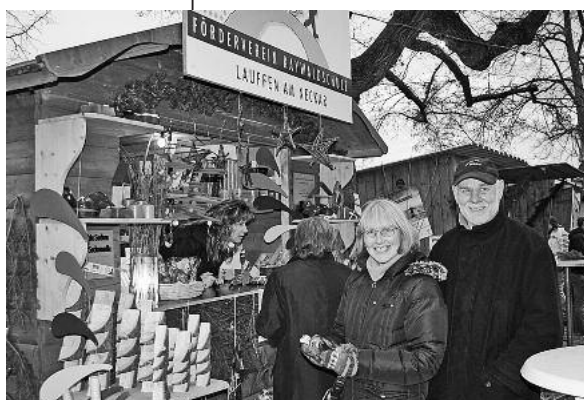
Die schöne Atmosphäre auf dem Kirchberg zieht jedes Jahr zahlreiche Besucherinnen und Besucher an – kommen auch Sie auf den kleinen aber feinen Weihnachtsmarkt.

Am Samstag und Sonntag, 4. und 5. Dezember, veranstaltet die evangelische Kirchengemeinde rund um die Regiswindiskirche bereits zum 13. Mal den traditionellen Lauffener Weihnachtsmarkt. Der Markt hat am Samstag von 16 bis 20 Uhr und am Sonntag von 11.30 bis 20 Uhr geöffnet.