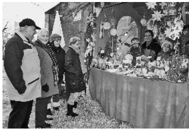
Bunt und mit liebevoll zusammengestellten Artikeln locken die Stände des heimeligen Markts um die Regiswindiskirche.

„Man könnte meinen, Kirche und Stadt verstehen sich nicht, sind doch beide seit Jahren immer nur am Mauern bauen“, scherzt Bürgermeister Klaus-Peter Waldenberger zum Auftakt des „schönsten Weihnachtsmarkts unserer Stadt.“ Dass dieser Scherz einen ernstesten Hintergrund hat, wissen die versammelten Weihnachtsmarktbesucher – wengleich nicht den, dass man sich nicht verstehen würde zwischen Insel und Kirchberg.