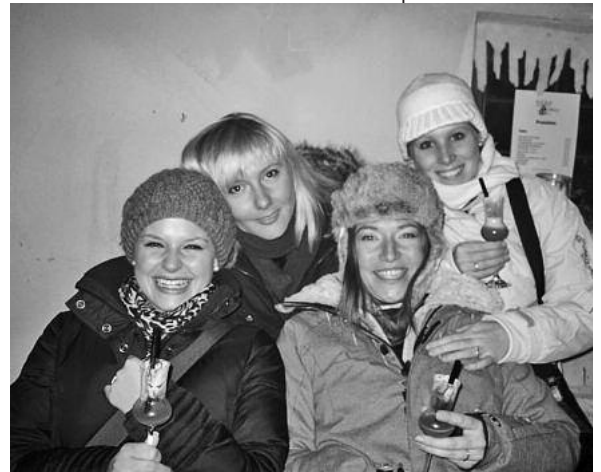
Feiern auch Sie mit guter Laune mit bei der Glühweinparty 2010.

Um Anmeldung (Tel. 07133/98250 oder unter www.gaestehaus-kraft.de ) wird gebeten. ■