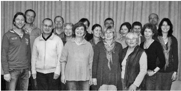
Das Alpha Team freut sich über Ihr Interesse.

Gesellige und inspirierende Einführung in den christlichen Glauben