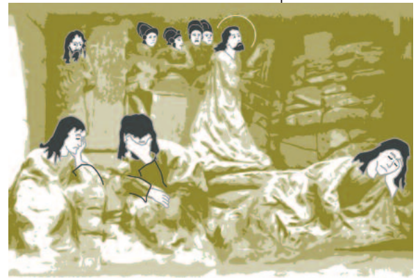
Das Bild zeigt die Mitglieder des Lauffener Heimatvereins, die am 13. Januar 2011 im Rahmen der Veranstaltung „Gruß aus Lauffen am Neckar“...

Dass weiterhin an der Verschönerung des Lauffener Stadtbildes gearbeitet wird, wird ehemalige Lauffenerinnen und Lauffener besonders interessieren. Die Neckaruferumgestaltung, die Mauersanierung rund um die Rathausburg, sowie die der Regiswindiskirche und die Sanierung des Ölberges in der Kirchenmauer finden Erwähnung im Brief an die Mitbürger im Ausland, vielleicht auch um einen Besuch der Heimat noch reizvoller zu machen.