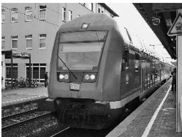
Mit der Bahn reisen wird von Lauffen aus jetzt noch einfacher.

Über die Homepage der Stuttgarter Straßenbahnen AG ( www.ssb-ag.de ) kann man ab sofort sowohl Einzel- als auch Gruppentagestickets des Verkehrs- und Tarifverbundes Stuttgart als Printticket erwerben und direkt einsteigen – ohne lästiges Warten und Kleingeld suchen am Fahrkartenautomaten.