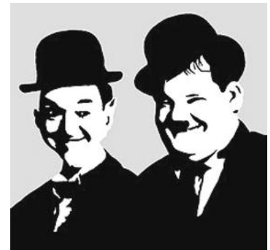
Unter dem Motto „Lachen mit Laurel & Hardy“ präsentiert der Filmklub die besten komödiantischen Kabinettstückchen des Duos.