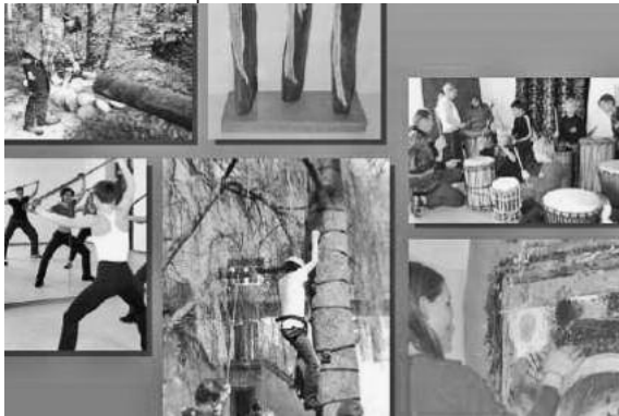
Die neuen Programmhefte liegen jetzt wieder überall bereit.