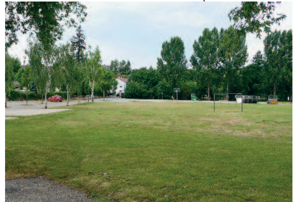
Der Kiesplatz bekommt ein völlig neues Gesicht.

Damit die Brutzeiten der Vögel nicht gestört werden, sollen 40 Bäume auf dem Kiesplatz bereits bis Ende Februar gefällt sein. Der Baubeginn der Maßnahme wird voraussichtlich Mitte Juni sein. Es werden so wenig wie möglich Bäume gefällt, eben die,