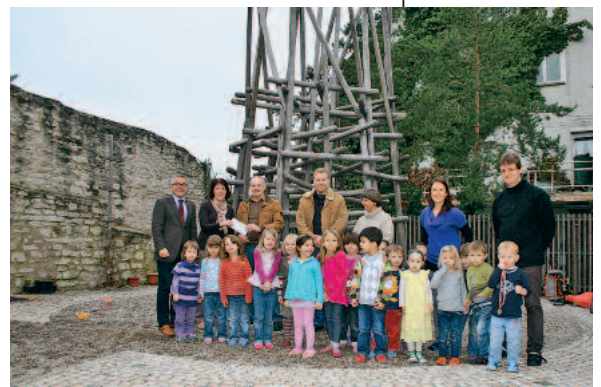
Das Team des Kindergarten Städtle freut sich sehr über die Spende des 1. Dart-Club OA.