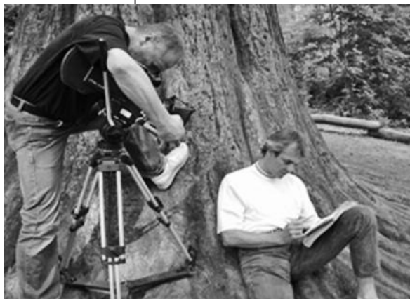
Film des Referenten Bernd Umbreit: „Zeit, die mir noch bleibt“.

Am Dienstag, 15. März, wird um 20 Uhr im Karl-Hartmann-Haus im Rahmen des ökumenischen