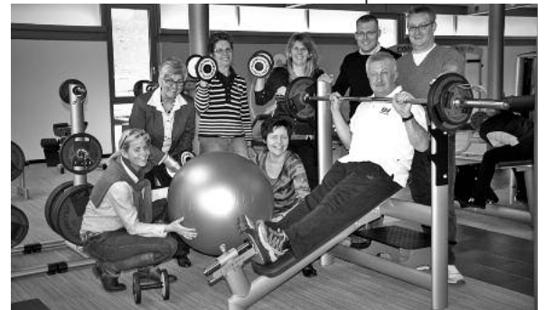
Die mitwirkenden Gastronomiebetriebe freuen sich auf Ihren Besuch: Bürgerstube, Café Sagenhaft (Pflanzen-Mauk), Dächle, Hotel Elefanten, Seybold's Fischrestaurant, Weinstube Sonne, Lauffener Weingärtner eG.

Gericht die passenden guten Tropfen. „Gemeinsam sind wir stark“ beweisen die Lauffener Lecker-Bissen-Gastronomen seit dem Jahr 2003. Bereits 25 Mal in Folge mit jeweils wechselnden ansprechenden Aktionen. Man erinnert sich gerne an vergangene attraktive, erfolgreiche Lecker-Bissen-Wochen wie z. B. „Fischwochen“, „Spargelwochen“, „Spezialitätenwochen“, „Sommer. Sonne. Leichte Küche.“, „Fit in den Frühling“, „Spätzle. Nudeln. Pasta.“, „Wein auf der Insel“, „Wilde Wochen“ ... ■