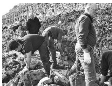
Aus den vielen losen Steinen entstand wieder eine haltbare Trockenmauer.

frisch gesetzt werden, leisten die Helferinnen und Helfer an diesem Tag jedes Jahr einen wichtigen Beitrag zum Erhalt der Kulturlandschaft.