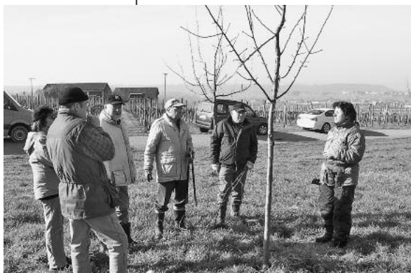
Bevor mit der Schere losgelegt wurde, erhielten die Teilnehmer des Obstbaumschnitts eine fachkundige Einführung.

Rein in Jacke und Gummistiefel und eine Reb-, Astschere oder Schaufel in die Hand, hieß es am vergangenen Wochenende in Lauffen a. N. wieder. Der Landschaftspflegetag stand vor der Tür und obwohl Regen angesagt war, konnten die immerhin 40 Helferinnen und Helfer an verschiedenen Orten unter blauem Himmel tätig werden.