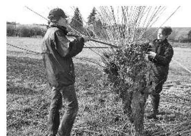
Weiden schneiden machte den Teilnehmern des Landschaftspflegetags richtig Spaß.