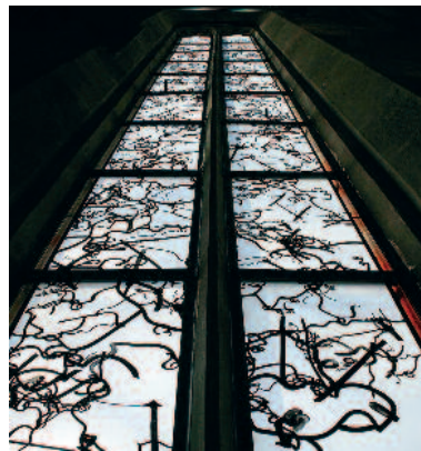
Das Passionsatorium von Carl Loewe: Ein geschichtsträchtiges Werk für die Gemeinde und den Chor der Regiswindiskirche.

Letztes großes Konzert unter der Leitung von Hartmut Clauß