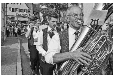
Die Stadtkapelle Lauffen a. N. wird die Festeröffnung traditionell begleiten.