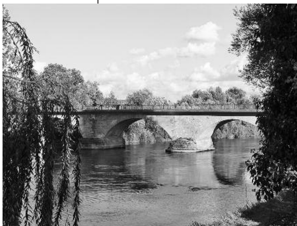
Der Neckar bei Lauffen inspirierte M.F. Sillum zu mehreren Balladen.

Der Eintritt kostet 10 Euro, ermäßigt für Schüler und Studenten 5 Euro. Ein Kartenvorverkauf findet nicht statt. ■