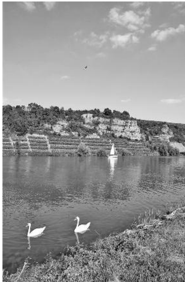
Am Krabbenfelsen vorbei führt eine Wanderung des Aktionstags „Unser Neckar“.

Erleben Sie IHREN Neckar in der Region Heilbronn-Franken! Von Neckarwestheim bis Gundelsheim finden zum landesweiten Aktionstag „Unser Neckar“ am Sonntag, 19. Juni, von 10 – 18 Uhr zahlreiche Veranstaltungen rund um den bedeutendsten und prägendsten Fluss Baden-Württembergs statt.