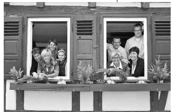
Die Teilnehmerbetriebe freuen sich auf zahlreiche Gäste.

Die teilnehmenden Gastronomen freuen sich auf die Gäste: Die Bürgerstube, das Dächle, das Hotel Elefanten, das Café Sagenhaft, das Fischrestaurant Seybold, die Weinstube Sonne. Weinempfehlungen gibt es von der Lauffener Weingärtner eG. ■