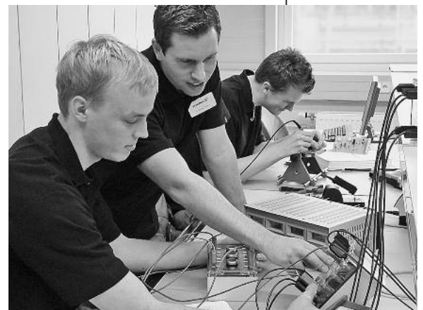
Insgesamt sechs Mitarbeiter sind bei SCHUNK hauptamtlich für den Fachkräftenachwuchs zuständig, weitere 75 Mitarbeiter fungieren in den einzelnen Bereichen als Ausbildungsverantwortliche.

herausragende Ausbildungsqualität weiter zu fördern, will Schunk im Herbst sein Qualitätsmanagement in der Ausbildung extern prüfen und zertifizieren lassen. Der künftige Nachwuchs kann sich schon heute freuen: Ordentliche Leistungen vorausgesetzt, bietet das Vorzeigeunternehmen derzeit allen Ausbildungsabsolventen eine Weiterbeschäftigung an. Nähere Informationen gibt es auf der eigens von Auszubildenden gestalteten Homepage unter www.schunk-ausbildung.de . ■