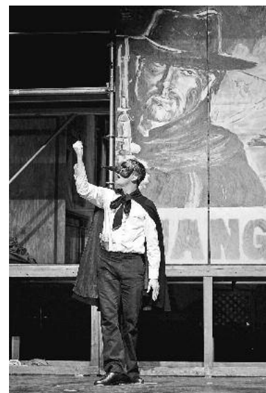
Spannende Abenteuer in Venedig verspricht Cornelia Funkes „Herr der Diebe“.