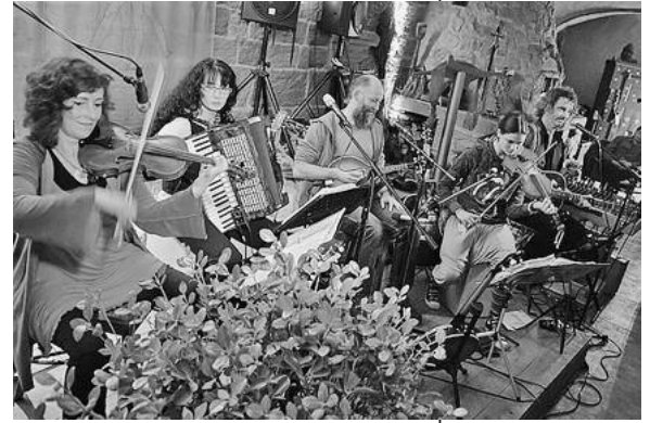
Die Gruppe FLAXMILL heizt die Stimmung ab 18 Uhr an.