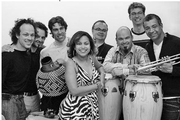
Die Band Salsafuerte ist international und hochkarätig besetzt.

Pulsierende Rhythmen, feurige Latino-Klänge und raffinierte Jazzimprovisationen: Die Latin-Band SALSAFUERTE um die Lauffener Jazzgröße Klaus Graf spielt am Freitag, 8. Juli, 20 Uhr im Hof der Hölderlin-Realschule Lauffen (bei Regen in der Aula) kraftvolle High-Energy-Musik, die jedem Zuhörer in Bauch und Beine geht und gleichzeitig nicht auf intelligente Jazzarrangements verzichtet. Die Idee zu dieser explosiven Mixtur entstand im Schmelztiegel New York, wo afro-kubanische Sounds und Jazz ganz organisch zu einem einmaligen Stil fusionieren, der heiße Mambos und groovende Songs hervorbringt. Bei atmosphärischen Jam-Sessions im New Yorker Latin-Club „Nuoricán“ fanden sich Musiker von internationalem Rang zu diesem Bandprojekt zusammen, das seitdem das europäische Publikum regelmäßig begeistert.