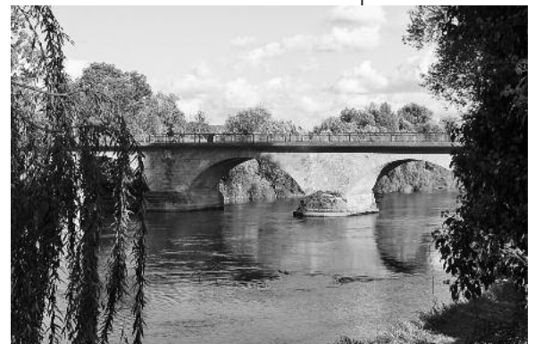
Der Neckar bei Lauffen inspirierte M.F. Sillum zu mehreren Balladen.

Der Eintritt kostet 10 Euro, ermäßigt für Schüler und Studenten 5 Euro. Ein Kartenvorverkauf findet nicht statt. ■