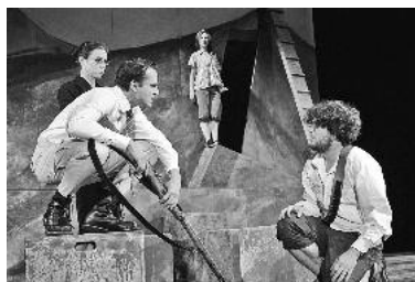
Der Freiheitskampf der Schweizer steht im Mittelpunkt des Klassikers von Schiller.

Schillers WILHELM TELL und Cornelia Funkes HERR DER DIEBE