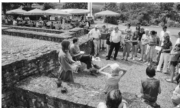
Inmitten der Weinberge können die Besucherinnen und Besucher römische Vergangenheit und heutige Weinkultur hautnah erleben.

Von Gutsherren und Soldaten, Ausgrabungen und Spielen, Kulinarik und Wein