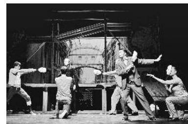
Abenteurer ab 6 Jahren reisen mit Cornelia Funkes „Herr der Diebe“ nach Venedig.

seller von Cornelia Funke, mit dem der Autorin der weltweite Durchbruch gelang.