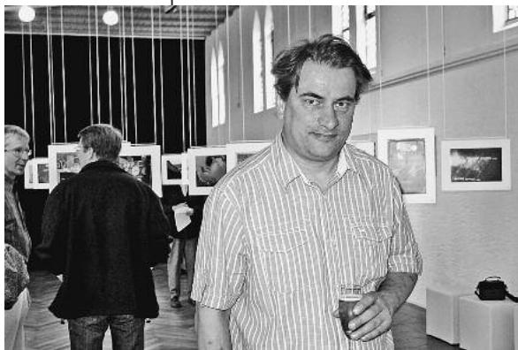
Matthias Balks Bilder machen nicht an der Oberfläche des schönen Motivs halt, sie deuten etwas an von den Geschichten, die hinter den Bildern stecken.

Fotoausstellung „Der Blick“ von Matthias Balk im Museum im Klosterhof eröffnet