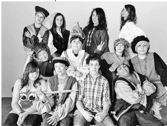
Die Theatergruppe der Hölderlin-Werkrealschule führt am 9. Juli beim Schulfest ein Musical auf.

Theaterprojekt von Spielkarre.de: Theater von Kindern für Kinder