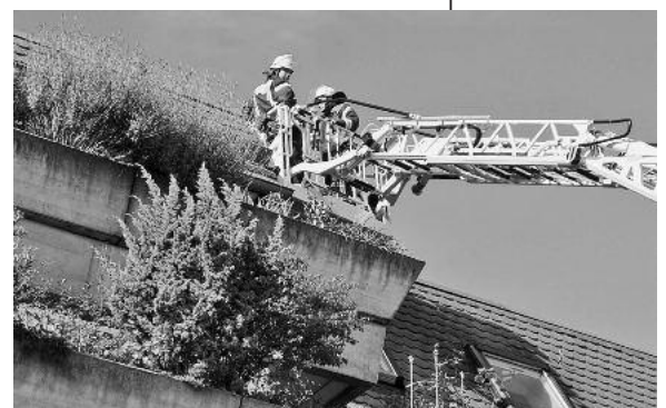
Im vergangenen Jahr wurde ein Brandfall am Gebäude Seestraße 1 (Terrassenhaus), simuliert, dieses Jahr ist die Hauptübung am Seniorenzentrum Haus Edelberg.

Damit wird der Bevölkerung in jedem Jahr einmal demonstriert, wie ein Einsatz der Feuerwehr vor sich geht und wie reibungslos Rettungs- und Löschkaktionen im Ernstfall ablaufen können, wenn eine gut trainierte Truppe, ausgestattet mit den entsprechenden technischen Hilfsmitteln, ausrückt. ■