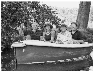
Informative und schöne Stadtführungen zu Land und zu Wasser genoss die Lauffen-Delegation in der Partnerstadt.