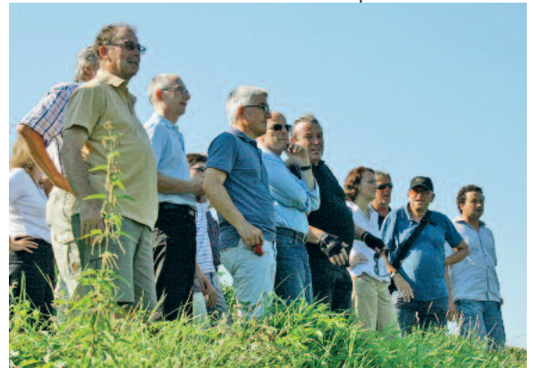
Gemeinsam schaut die Radweg-Delegation die Querungsmöglichkeiten beim Horkheimer Wehr von oben an.

Hilfe auf dem Weg aus der Zwickmühle versprechen sich die Beteiligten nun von Winfried Hermann, in dessen Zuständigkeit als Landesvertreter der Radweg fällt. Zuständig für die Finanzierung ist das Land Baden-Württemberg, wobei sich die Förderlandschaft für den Neckartalradweg insgesamt sehr positiv darstellt. Das Entflechtungsgesetz des Landes bietet Lauffen a. N. die Möglichkeit, 50 Prozent der Gesamtkosten für die Streckenführung des Radwegs, im Falle von Brücken sogar 70 Prozent zu erhalten. Ein pauschalierter Zuschuss in Höhe von 800.000 Euro wird zusätzlich vom Bund in Aussicht gestellt. Kombiniert mit einem Eigenanteil von Lauffen a. N. und Heilbronn von je etwa 100.000 Euro wären damit die Grundkosten für die favorisierte linksseitige Streckenführung mit Querung im Bereich Horkheim, die in der Gemeinderatssitzung vom 25.05.2011 von den Planern auf 1,7 bis zu 2 Mio. Euro beziffert wurden, bereits gedeckt. Je nach den Auflagen seitens des Natur-