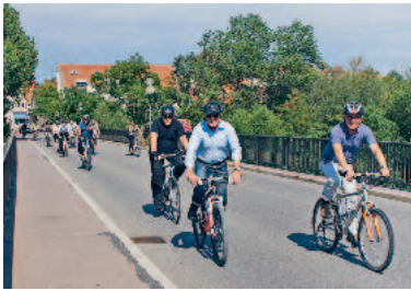
Verkehrsminister Winfried Hermann (v. l.) besichtigt den Neckartalradweg bei Lauffen a. N. vor Ort.