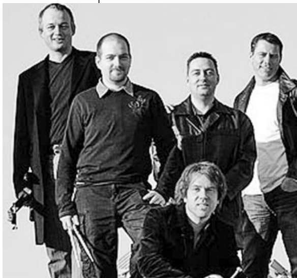
Heimer's Welt serviert musikalische und kulinarische Leckerbissen.

Ab heute finden die Fans des Kulturprogramms der Stadt Lauffen a. N. alle Infos und das Neueste zu den Veranstaltungshighlights in der Neckarstadt nicht mehr nur auf der städtischen Internetseite www.lauffen.de , sondern auch bei facebook.