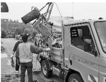
Mit dem Sinkkastenreiniger werden die Schächte gereinigt.

Mitarbeiter des städtischen Bauhofs werden in den nächsten Wochen im gesamten Stadtgebiet Schächte reinigen, damit auch bei stärkeren oder länger anhaltenden Regenfällen der Wasserab-