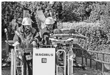
Auf einer Trage retten die Einsatzkräfte der FFL eine bewegungsunfähige Person aus dem Dachgeschoss des Hauses Edelberg.

Die Suche und Rettung von Personen in einem Brandobjekt geht in der Regel immer vor der Brandbekämpfung, da bereits wenige Atemzüge des giftigen Brandrauches zu gefährlichen Störungen der Vitalfunktionen, bzw. bis zum Tod führen können. Unter Atemschutz und mit einer Wärmebildkamera ausgerüstet, geht der erste Trupp unmittelbar ins betroffene Untergeschoss vor. Unter einer Türe des Bibliothekraumes quillt deutlich sichtbar Rauch hervor. Nach dem Öffnen der Zimmertüre machen im stark verrauchten Zimmer gleich zwei Personen durch Rufen auf sich aufmerksam. Mit der Wärmebildkamera können diese dann zügig lokalisiert und aus dem Brandraum verbracht werden. In einem weiteren Raum werden noch zwei weitere Personen aufgefunden, welche alle durch weitere Trupps aus dem Gebäude gerettet und an das örtliche DRK zur Erstversorgung übergeben werden. Die Brandquelle kann dann umgehend mit einem C-Rohr abgelöscht werden. Während der Rettungs- und Löscharbeiten im Untergeschoss werden zeitgleich zwei nicht mehr gehfähige Personen mit der Drehleiter aus dem Obergeschoss gerettet.