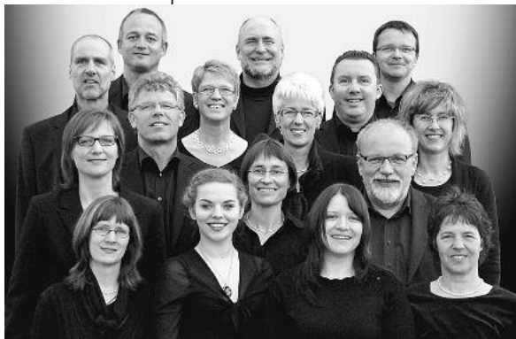
Vokalensemble Zwölfklang

Das Vokalensemble Zwölfklang präsentiert sein Sommerkonzertprogramm am Samstag, 17. September, um 19 Uhr in der Regiswindiskirche Lauffen a. N. und am Sonntag, 18. September um 18 Uhr in der Klosterkirche Bebenhausen bei Tübingen.