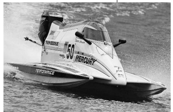
Das Internationale ADAC DMYV Motorbootrennen bietet Motorsport zum Anfassen.

Eintrittskarten gibt es an der Tageskasse zu 5 Euro nur für samstags, und zu 11 Euro für samstags und sonntags. Informationen unter 0172/7034444. ■