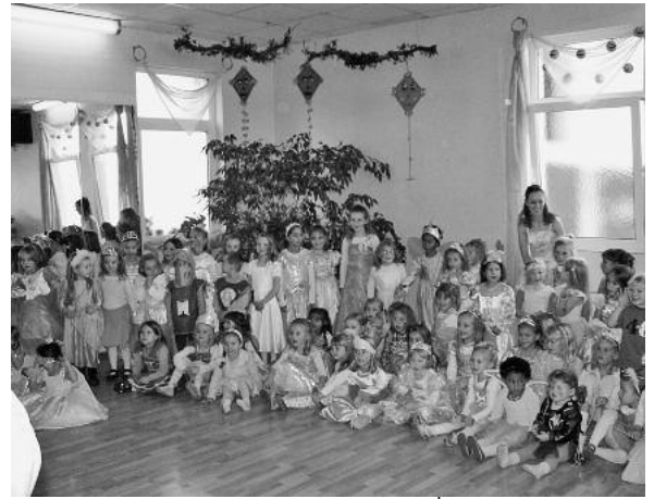
Bei der Lillifee-Party gibt es viele Überraschungen zu erleben.

Karten nur im Vorverkauf unter 07133/21639 oder info@tanzschule-birkel.de . Weitere Informationen finden Sie unter www.tanzschule-birkel.de . ■