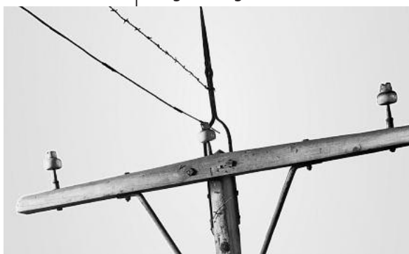
Wie alles begann: Historischer Strommast.