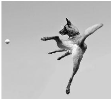
Cash, so heißt dieser Belgische Schäferhund, ist ein absoluter Flughund. Entstanden sind eine ganze Reihe spektakulärer Fotos, denn er zeigt unglaublich vielfältige und kreative Posen in der Luft.