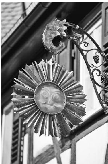
Die Weinstube Sonne (Vor- und Nachspeise) und das Café Restaurant Lichtburg (Hauptgericht) sind die kulinarischen Stationen der Stadtführung.

Kulinarische Hochgenüsse verfeinert mit einer Portion Geschichte gibt es am Samstag, 22. Oktober, bei der ersten kulinarisch-kulturellen Stadtführung durch die Weinstadt am Neckarufer.