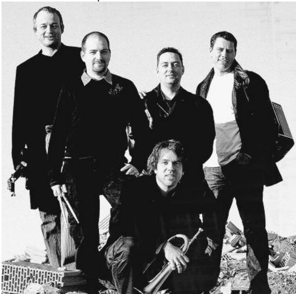
Die Band „Wendrsonn“ sorgt mit Mundart und mitreißender Musik für beste Unterhaltung.

Am Samstag, 29. Oktober, servieren die Bürgerstube und „Heimer's Welt“ in der Lauffener Stadthalle um 19 Uhr wieder ein musikalisch-kulinarisches „3-Gänge-Menü“. Am Samstag, 5. November, setzt der Schwäbische Albverein noch eins drauf: Mit der Gruppe „Wendrsonn“ präsentiert er Mundart-Rock vom Feinsten.