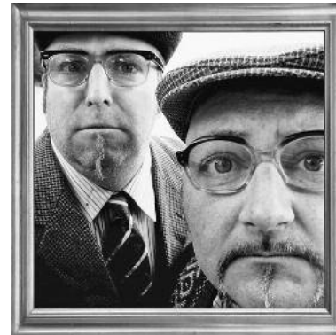
Weitere Infos auch unter www.superzwei.de .

medy-Einlagen die Klinke in die Hand. Thematisch bewegen sich SUPERZWEI (ehemals nimmzwei) in ihrem Programm-Marathon zwischen alltäglichem Wahnsinn, unwichtigem Unsinn und wesentlichem Tiefsinn. Sie karikieren verschiedenste Facetten des Lebens, philosophieren gekonnt über die Welt und Gott und berühren dabei meisterlich Herzen und Zwerchfell. Die Lachmuskulatur sollte schon mal warm trainiert werden. Karten gibt es bei Buch und Papier Schreyer. Einlass ist ab 19 Uhr. ■