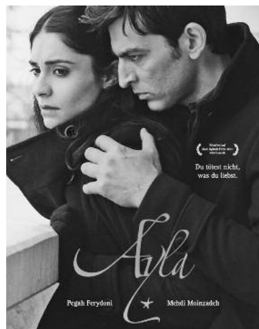
Ayla – Ein spannender, mitreißender Film über das Leben einer modernen türkischen Frau

nisten wird auf die Probe gestellt, als der Mann unter dem Druck der auf ihm lastenden gesellschaftlichen Zwänge die von seiner Schwester