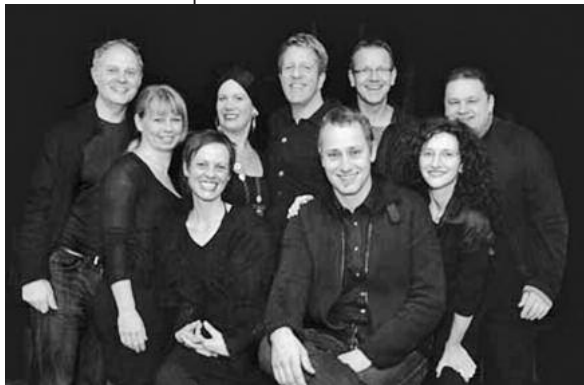
Erleben Sie bei der Church Night ein Konzert mit some voices.

Erleben Sie die Regiswindiskirche am Reformationstag in besonderer Atmosphäre am Abend: Zur Church Night am Montag, 31. Oktober. Um 20 Uhr wird die KirchenLounge eröffnet, um 21 Uhr be-