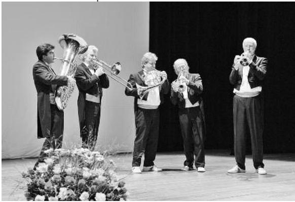
Ludwigsburger Blechbläser Quintett.