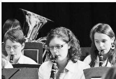
Nach intensiver Probenarbeit freuen sich die jungen Musikanten auf einen tollen Konzertnachmittag.

Am Sonntag, 23. Oktober, um 14.30 Uhr veranstaltet die Ju-