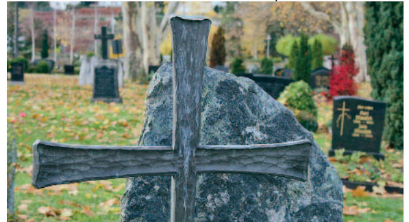
Gemeinsames Gedenken soll Frieden erhalten.

Der Volkstrauertag schützt vor dem Vergessen und Verdrängen. Er mahnt uns, aus den Schreckensbildern der Vergangenheit die richtigen Schlüsse zu ziehen. Gegen Krieg und Gewalt und für Frieden, Freiheit, Gerechtigkeit und Menschlichkeit.