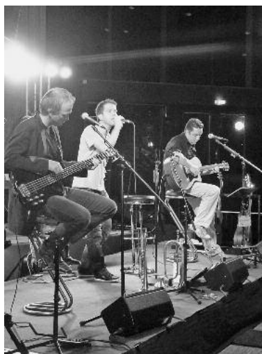
Eine Veranstaltung mit Zutaten, die alle äußerst wohlschmeckend und fachlich brillant waren.

Ein kulinarisches Konzert mit Heimer's Welt in der Stadthalle