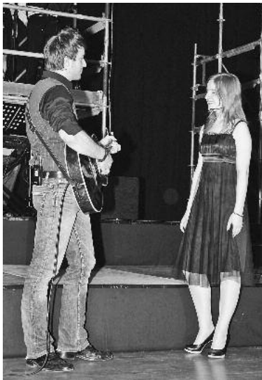
Das Verhältnis von Mann und Frau steht im Mittelpunkt der „Fremde Wesen“-Revue.