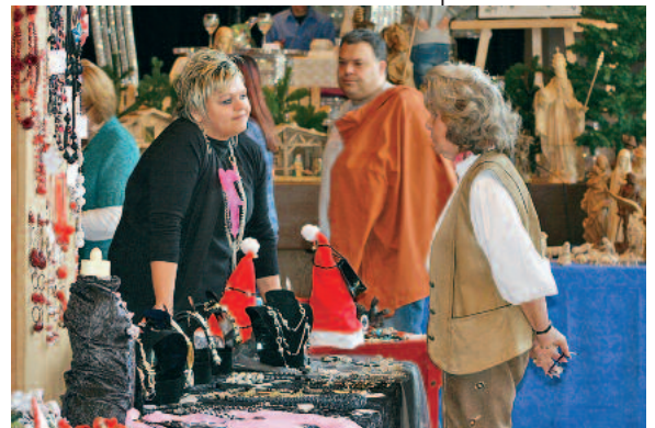
Auch für die Jüngsten ist der Besuch bei den Hobbykünstlern immer sehr spannend.