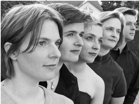
Zwölfklang musizieren gemeinsam mit der Camerata Lichdi (hier im Bild)

Nach der Aufführung des Weihnachtssoratoriums im Herbst 2010 haben Zwölfklang und die Camerata Lichdi sich entschlossen, dieses Jahr gleich wieder ein spektakuläres Projekt auf die Beine zu stellen: Wolfgang Amadeus Mozart – Requiem KV 626, Johann Sebastian Bach – Kantate BWV 82a „Ich habe genug“.