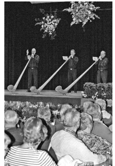
Das Alphorn-Trio Hornizont versetzte die Zuhörerschaft mit einem perfekten Auftritt in Erstaunen.

Gaida zusammengestellte Bilderschau von den blühenden Gärten, Höfen, Balkonen, Kübeln und Dekorationen, die liebevoll präsentiert, was der Bürgermeister eingangs festgestellt hatte, nämlich dass die Lauffener Blumenfreunde den Liebesgedanken der Natur das ganze Jahr über leben.