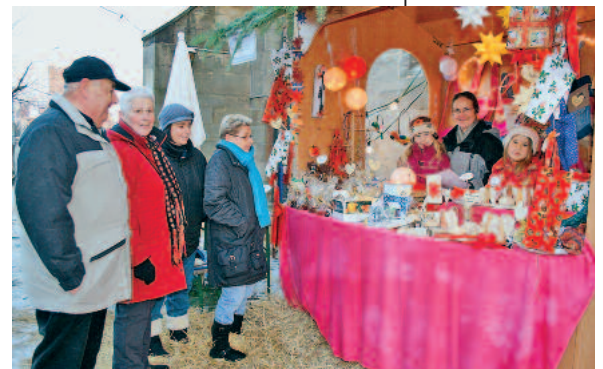
Rund um die Regiswindiskirche verzaubern kleine Stände die Weihnachtsmarktbesucher.

Selbstgebasteltes sowie Essen und Trinken zum Verkauf an. Von Kunstgegenständen bis hin zum immergrünen Christbaumschmuck bietet der diesjährige Markt wieder alles, was den weihnachtlichen Gabentisch ziert. Selbstverständlich gibt es auch Glühwein, Crêpes, Kaffee und Kuchen, Steaks und anderes. Ein umfangreiches Programm in der Kirche rundet das Marktgeschehen ab und bietet Gelegenheit zum Aufwärmen und Nachdenken. ■