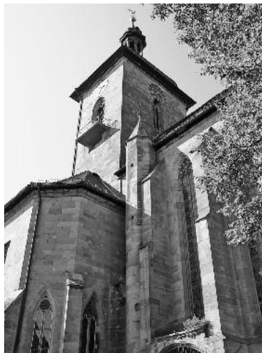
Der 3. Dezember-Treff soll der Regiswindiskirche helfen, sich bald wieder, wie hier im Bild, stolz ohne Gerüst präsentieren zu können.