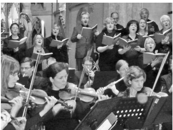
„Bahnt unserm Herrn einen Weg“ intonieren die 34 Sängerinnen und Sänger mit voller Stimmkraft.

Adventskantate „Lichter der Hoffnung“ stimmte auf die Adventszeit ein