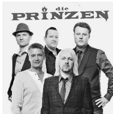
Die Prinzen werden mit dem MGV Urbanus für ein Lied gemeinsam auf der Bühne stehen.

Das Veranstaltungshighlight 2012 – Die Prinzen