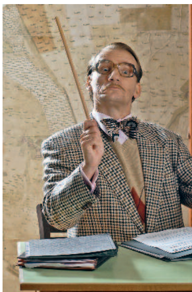
„Bomsl ist Bildung!“.