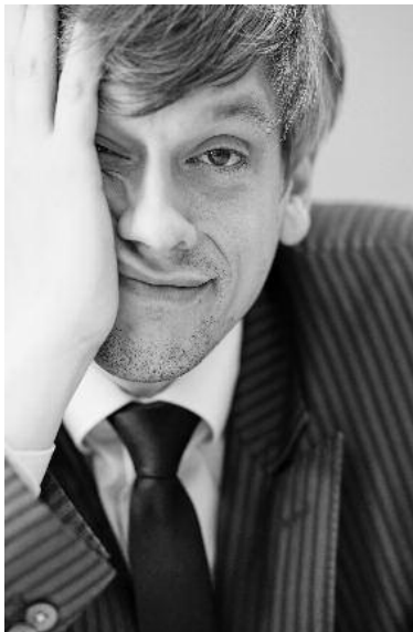
Wer vergessen will, muss sich erinnern.

Freunde des Polit-Kabarets sollten es sich nicht nehmen lassen, die Highlights des Jahres satirisch aufbereitet zu bekommen – live zu erleben am Freitag, 23. Dezember, um 20 Uhr im Lauffener Vogtshofkeller. Jedes Jahr die gleiche Frage: Muss man an Silvester freudlos saufen? Der Jahresendschwips gilt als der tristeste seit der Wiedervereinigung, dient er doch dem dumpfsten aller Zwecke: Der Silvestersäufer will vergessen.