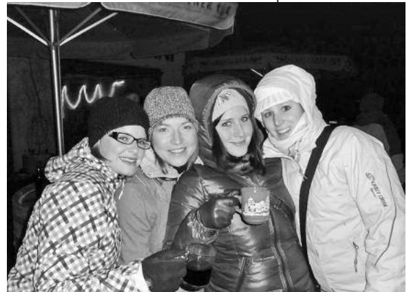
Die Glühweinparty im Hof des Gästehauses Kraft stimmt auf Weihnachten ein.

Mitmachen kann jeder, egal ob Nordic-Walking, Jogging, Laufen oder Wandern. Hier sind alle richtig. Prämiert werden das originellste Kostüm, die weiteste Anreise sowie der jüngste und älteste Teilnehmer.