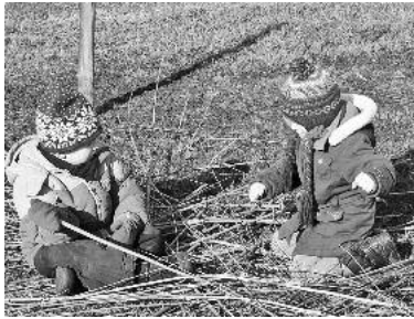
Der Landschaftspflege-Tag – ein Spaß für alle Naturfreunde

Am Samstag, 11. Februar, können Groß und Klein einen spannenden Tag in der Natur erleben und einen Beitrag zum Erhalt unserer Kulturlandschaft leisten. Treffpunkt für alle Teilnehmer ist um 9 Uhr der Parkplatz am Fischerheim am See-graben.