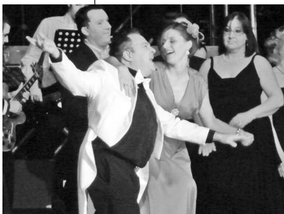
Die gute Stimmung bei „Fremde Wesen“ griff ruck zuck aufs Publikum über, egal ob männlich oder weiblich.

Die Young Chorporation gastierte mit „Fremde Wesen“ in Lauffen