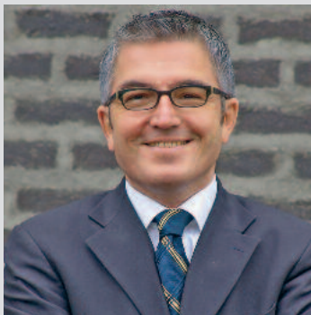
Bei der Bürgersprechstunde können die Belange der Bürgerinnen und Bürger persönlich vorgetragen werden.

man etwas über indische, schwäbische oder italienische Küche. Auch in den Bereichen Geschichte, Tanz & Musik, Natur und EDV wird den Bürgerinnen und Bürgern eine große Vielfalt geboten. Schauen Sie doch einfach mal in das angefertigte Programmheft rein und entscheiden Sie selbst, was zu Ihnen passt. Bei Rosemarie Meyer, der Stadtverwaltung und dem Bürgerbüro in Lauffen erhalten Sie weitere Informationen oder können sich anmelden: Tel. 07133/106-51, Fax: 07133/106-19, E-Mail: lauffen@vhs-unterland.de oder auf dem Handy: 0163/8100364. ■