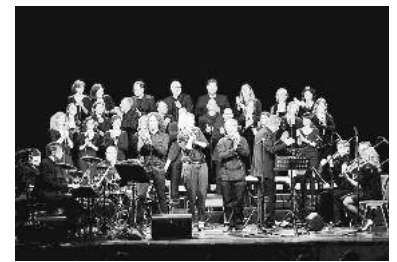
Musikalische Unterhaltung der Extraklasse für einem guten Zweck: der LAKI PopChor on Tour.

Am Sonntag, 29. Januar, ist der LAKI Popchor auf seiner Tour „Joyful“ um 19 Uhr in der Regiswindiskirche in Lauffen a. N. zu Gast. Das abwechslungsreiche Repertoire geht vom groovigen Gospel über packende Popsongs hin zu Liedern aus dem Gottesdienst.