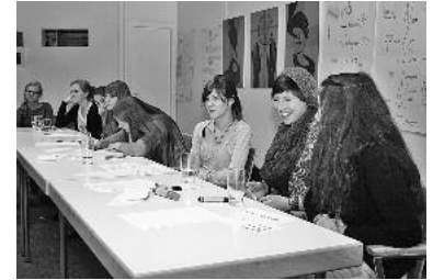
Bei der Klausur und den ersten Sitzungen wurde mit Freude diskutiert und an neuen Konzepten gefeilt.

Doch lange blieben wir nicht getrennt – am 12. Januar trafen wir uns zu unserer zweiten offiziellen Sitzung im großen Saal des Lauffener Rathauses. Als erster Punkt auf der Tagesordnung stand die Planung unserer youtube-Aktion. Um bekannter zu werden, wollen wir Jugendliche aus Lauffen direkt fragen, was sie sich in ihrer Stadt wünschen und wofür wir uns einsetzen sollen. Als kleiner Film wird dies auf youtube veröffentlicht werden. Das Organisatorische ist nun erledigt, so dass dieses Projekt demnächst starten kann.