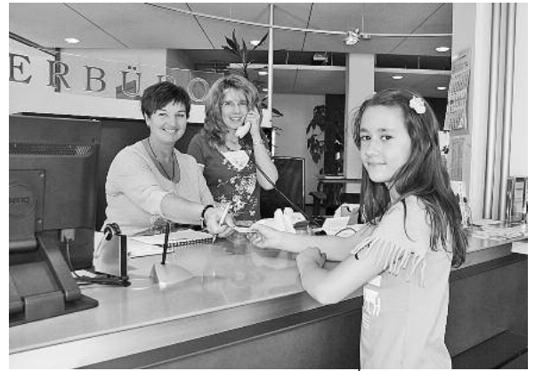
Erste Anlaufstelle im BBL: Die Thekenmitarbeiterinnen sind wichtige Ansprechpartnerinnen für viele verschiedene Bürger- und Touristenanliegen.

Viel zu tun hatte auch das Einwohnermeldeamt. Von den 1.762 zu bearbeitenden Meldevorgängen gab es 579 Zuzüge, 720 Wegzüge und 463 Umzüge in Lauffen a. N. Es gab fast doppelt so viele Sterbefälle (124) wie Geburten (64). Es wurden über 1959 Ausweisdokumente, hierbei rund 64 % Personalausweise, erstellt. Bei der Landtagswahl wurden 1.130 Wahlscheine und bei der Volksabstimmung 1.000 Stimm-scheine ausgestellt. Isabel Zentarra