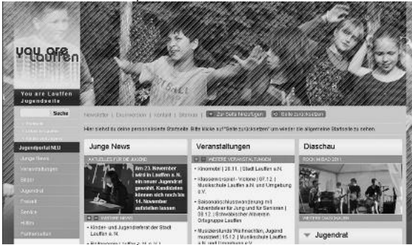
Mehr zum Jugendrat und zu vielen Jugendthemen liest man unter www.you-are-lauffen.de < http://www.you-are-lauffen.de >