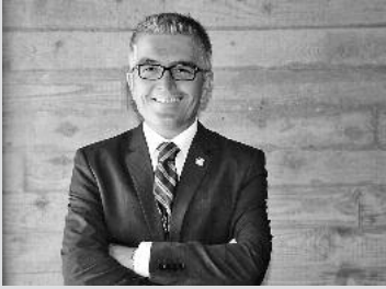
Bei der Bürgersprechstunde können die Belange der Bürgerinnen und Bürger persönlich vorgetragen werden.