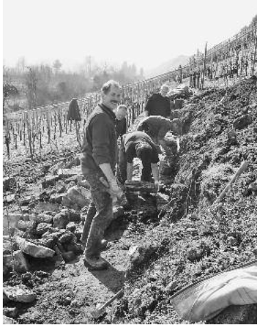
Für den Landschaftspflege-Tag werden weiterhin fleißige Helfer gesucht.

Am Samstag, 11. Februar, können Groß und Klein einen spannenden Tag in der Natur erleben und einen Beitrag zum Erhalt unserer Kulturlandschaft leisten. Treffpunkt für alle Teilnehmer ist um 9 Uhr der Parkplatz am Fischerheim am Seegraben.