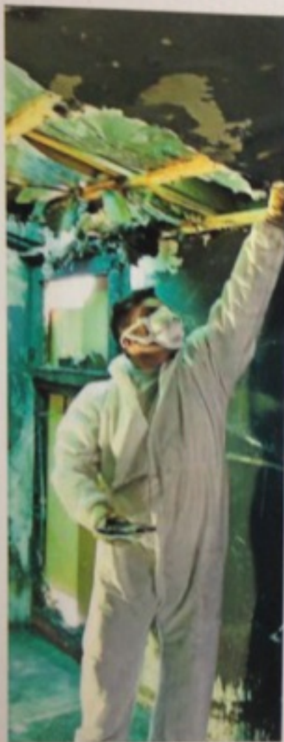
Im April brennt der Kindergarten in der Charlottenstraße.