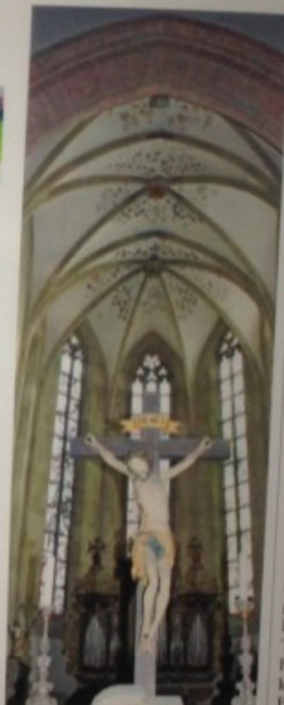
Die Sanierung der Regiswindiskirche ist abgeschlossen.