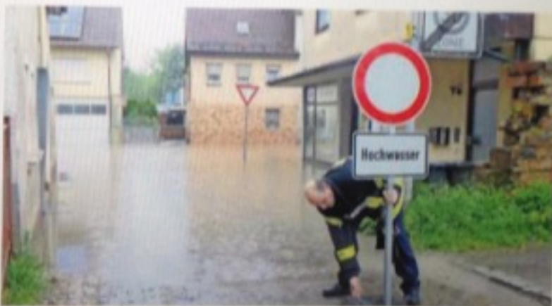
Der Sommer bringt nicht nur Sonne, sondern auch viel Regen: „Land unter“ heißt es in der Stadt Anfang Juni.