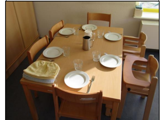
Frühstückstisch der Krippenkinder im Essraum