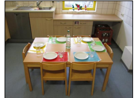
Frühstückstisch der Kiga- Kinder in der Küche