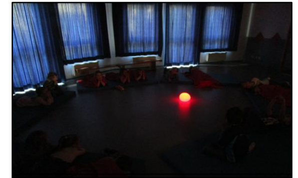
Ruhephase in der Turnhalle

Die Kinder ziehen sich an und werden von einer Erzieher*in nach draußen zu den Eltern begleitet.