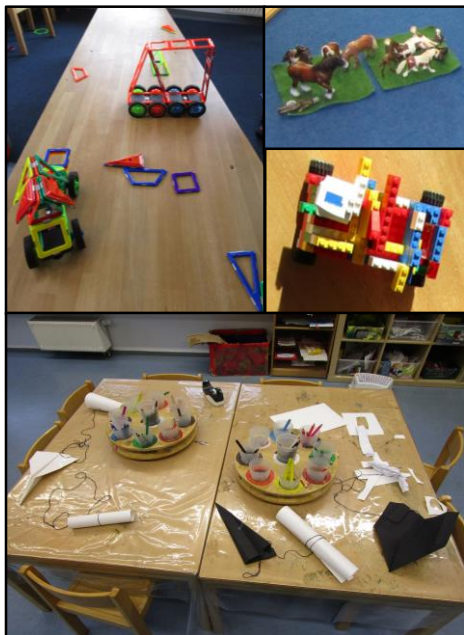
Bauzimmer & Kreativzimmer