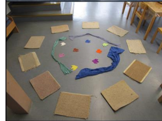
Morgenkreis in der Krippe & Morgenkreis im Kiga