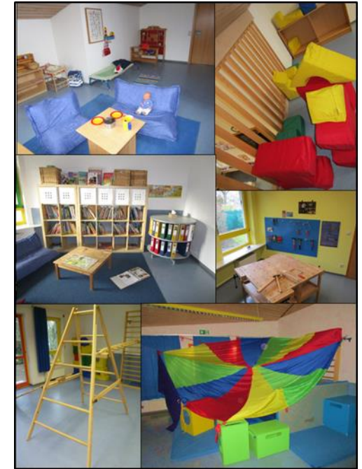
Nebenräume: Rollenspielbereiche, Turnhalle, Lese- & Schreibwerkstatt, Werkstatt