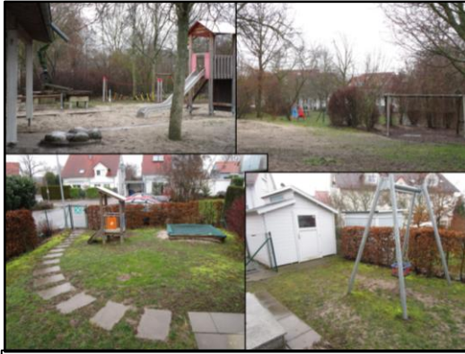
Gartenbereiche Kiga & Krippe