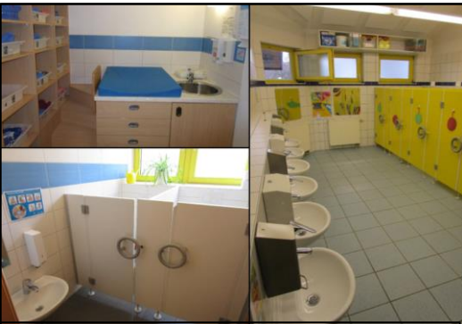
Waschräume & Wickelbereich

Mindestens 1x am Tag und immer bei Bedarf werden die Kinder gewickelt. Kinder werden gefragt, welche Fachkraft sie zum Wickeln / zur Toilette begleiten darf.