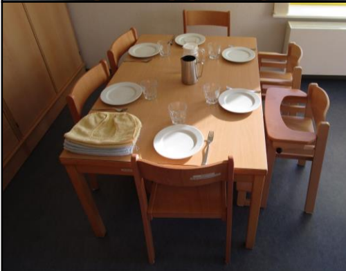
Mittagessen: in der Küche und im Essraum