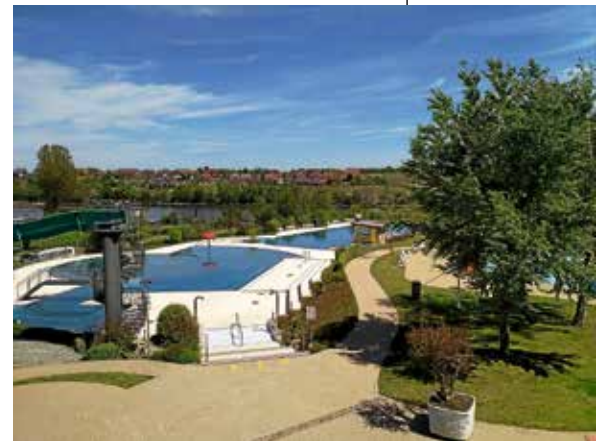
Freibad Lauffen a.N.

Der Gemeinderat fasste zur Vorlage 2023 Nr. 29 folgenden einstimmigen Beschluss: