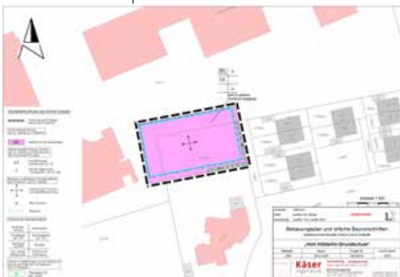
Vorentwurf „Hort Hölderlin-Grundschule“ des Büros Käser Ingenieure, Untergruppenbach vom 09.03.2023

Der Gemeinderat der Stadt Lauffen am Neckar hat am 29.03.2023 in öffentlicher Sitzung beschlossen, den Bebauungsplan und die örtlichen Bauvorschriften „Hort Hölderlin-Grundschule“ aufzustellen. Dieser Beschluss wird hiermit öffentlich bekannt gemacht.