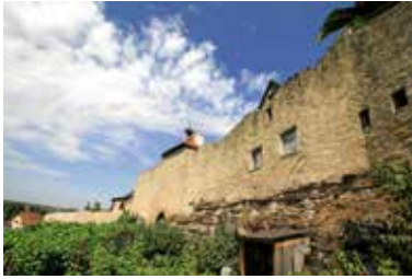
Altes Heilbronner Tor

Diese öffentliche Führung mit Gästeführer Karlheinz Torschmied hat das Lauffener „Städtle“ zum Ziel. Bei diesem Rundgang durch den am rechten Neckarufer gelegenen historischen Stadtteil werden u. a. geschichtsträchtige Gebäude erschlossen. Die rund zweistündige Führung startet um 15 Uhr im Rathaushof mit der um 1100 von den „Popponen“ errichteten Burg der Grafen von Lauffen. Die Führung zeigt weiterhin die imposante seit 1274 bestehende und heute noch weitgehend erhaltene Stadtmauer mit den Durchlässen „Altes“ und „Neues Heilbronner Tor“. Sie führt zum Gebäude „Engelhansen“ und zu den Gefängniszellen. Eine weitere Station ist die Martinskirche, die um 1200 einst als Nikolauskapelle zusammen mit der Gründung des „Städtle“ erbaut wurde. Die Führung kostet für Erwachsene 5 €; Kinder dürfen kostenfrei teilnehmen. Treffpunkt ist am Samstag, 15. April, um 15 Uhr der Rathaushof, Rathausstr. 10, 74348 Lauffen. Informationen bei Gästeführer Karlheinz Torschmied, Tel. 07133/7722 bzw. torschmied@t-online.de.