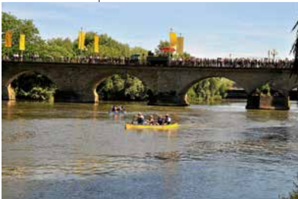
Katzenbeißer Cup 2017

Jetzt anmelden und beim Fun-Triathlon im Rahmen des Brückenfestes mitmachen!