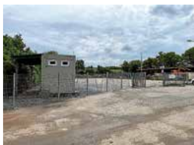
Einfahrt des neu gestalteten Recyclinghofs

Des Weiteren wurde der Wertstoffhof mit Strom, Wasser- und Abwasserleitungen versorgt.