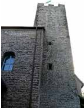
Mauern des Rathausurmes