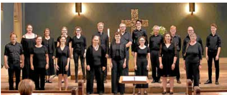
Das Vokalensemble „alto e basso“ bringt das Thema „Hoffnung“ zum Klingen.

Eine Veranstaltung der Ev. Kirchengemeinde Lauffen a.N. – Neckarwestheim ■